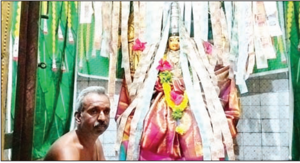
అమ్మవారి సన్నిధిలో ప్రతిరోజు కుంకుమ పూజలు