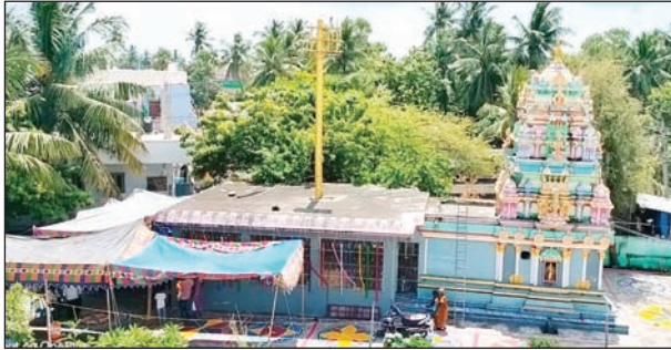
ప్రతి రోజు దేవస్థానంలో కుంకుమ పూజలు.

కోడూరు, మేజర్ స్వాస్ : కోడూరు గ్రామంలో వేంచేసి ఉన్న శ్రీ కనకదుర్గ అమ్మవారి దేవస్థానంలో దేవి శరన్నవరాత్రి ఉత్సవాలు ఘనంగా జరుగుతున్నాయి. ప్రతి సంవత్సరం కూడా శరన్నవరాత్రి ఉత్సవాలను ఆలయ కమిటీ సభ్యులు నిర్వహిస్తూ వస్తున్నారు. శరన్నవరాత్రి అరవ రోజున కనకదుర్గమ్మ అమ్మవారు మహాలక్ష్మి దేవి అలంకరణలో భక్తులకు దర్శనం ఇచ్చారు. దాదాపు లక్ష రూపాయలు నగదుతో అమ్మవారికి అలంకరణ చేశారు. అమ్మవారి దర్శనానికి పెద్ద సంఖ్యలో భక్తులు తరలివచ్చి దీవించమని కనకదుర్గమ్మ అంటూ వేడుకుంటున్నారు. దేవస్థానం వద్ద ప్రతిరోజు అన్న సమారాధన కార్యక్రమాన్ని భక్తుల సహకారంతో కమిటీ సభ్యులు నిర్వహిస్తున్నారు.