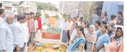
అభివృద్ధి పనులకు భూమి పూజ చేస్తున్న దృశ్యం

బనగానపల్లె మేజర్, న్యూస్ : రాష్ట్ర ప్రభుత్వం ప్రతిష్టాత్మకంగా చేపట్టిన పల్లె పండుగ పంచాయతీ వారోత్సవాల్లో భాగంగా శుక్రవారం వెంకటాపురం, చెరువుపల్లె, రామతీర్థం గ్రామాల్లో కార్యక్రమాన్ని నిర్వహించడం జరిగింది.