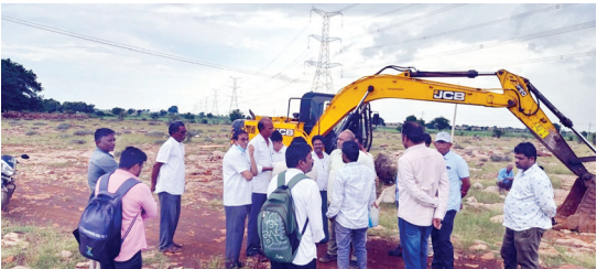
తహశీల్దార్ ను అడ్డగించిన గ్రామస్తులు