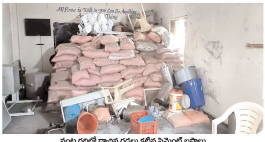
వంట గదిలో దాచిన గడ్డలు కట్టిన సిమెంట్ బస్తాలు

బండి ఆత్మకూరు రూరల్, మేజర్ న్యూస్ : ఒకటి కాదు రెండు కాదు ఏకంగా 2 వందలకు పైగా సిమెంట్ బస్తాలు నిర్మాణాలకు వినియోగించక పనికిరాకుండా పోయాయి. ప్రభుత్వం నాడు - నేడు పనుల నిర్వహణ కోసం సమకూర్చిన సిమెంట్ బస్తాలను కింది స్థాయి అధికారులు సక్రమంగా వినియోగించకపోవడంలో నిర్లక్ష్యంగా ఉండటంతో ప్రభుత్వం ధనం పాఠశాల గదిలో మూలన పడింది. వివరాల్లోకితే గత వైసిపి ప్రభుత్వం లో పాఠశాల అభివృద్ధి పేరుతో చేపట్టిన నాడు నేడు పథకం ద్వారా బండి ఆత్మకూరు కస్తూరిబా బాలికల పాఠశాలలో అదనపు తరగతుల నిర్మాణానికి పెద్ద ఎత్తున నిధులు సమకూర్చారు. భవన నిర్మాణాలను చేపట్టడానికి ప్రభుత్వం సిమెంట్ బస్తాలతో పాటు నిర్మాణానికి అవసరమైన సామగ్రిని కల్పించారు. ప్రభుత్వ సొమ్మును జాగ్రత్తగా కాపాడాలని అధికారులు నిర్లక్ష్యానికి 200 కు పైగా సిమెంట్ బస్తాలు గడ్డ కట్టి పడైపోయాయి. దాదాపు రూ.లక్షకు పైగా ప్రజా ధనం