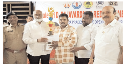
బహుమతులు అందజేస్తున్న దృశ్యం