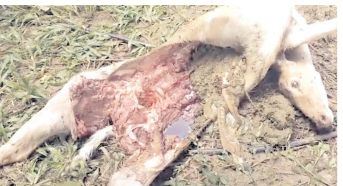
కుక్కల దాడిలో మృతి చెందిన దుప్పి

ఆత్మకూరు, మేజర్ న్యూస్: కుక్కల దాడిలో చుక్కల దుప్పి మృతి చెందిన సంఘటన శుక్రవారం మండలంలోని స్పృతివనం సమీపంలో చోటు చేసుకుంది. అటవీ శాఖ అధికారుల వివరాల మేరకు మండలంలోని నల్లకాల్వ గ్రామ సమీపం అటవీ ప్రాంతంలో నిర్మించిన వైఎస్సార్ స్మృతివనం సమీపంలో దుప్పిపై కుక్కలు దాడి చేయడం జరిగిందన్నారు. తప్పించుకొనే ప్రయత్నంలో దుప్పి స్పృతివనం వద్ద ఉన్న టవర్ వద్దకు చేరుకున్నా కుక్కల దాడిలో తీవ్రంగా దుప్పికి గాయాలు కావడంతో మృతి చెందింది. విషయం తెలుసుకున్న అటవీ శాఖ అధికారులు సంఘటన స్థలానికి చేరుకొని పోస్టుమార్టం నిర్వహించి కణసం చేసినట్లు అటవీ శాఖ అధికారులు తెలిపారు.