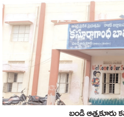
బండి ఆత్మకూరు కస్తూరి బా బాలిక పాఠశాల

వృధాగా కస్తూరిబా బాలికల పాఠశాలలో వంట గదిలో దర్జన మిస్తుంది. విషయం బయటకు రాకుండా బండి ఆత్మకూరు-2 ఇంజనీరింగ్ అసిస్టెంట్ జాగ్రత్త పడ్డారు. నాడు నేడు పనులలో ఉపయోగించాల్సిన సిమెంట్ బస్తాలను అధికారులు గుర్తించలేక పోయాారా? తెలిసి కూడా నిర్లక్ష్యంగా వ్యవహరించారా? అని అనుమానాలు తలెత్తుతున్నాయి. ఏదైనా ప్రభుత్వ పథకంలో అన్నానికి లబ్ధి జరిగితే విచారణ చేపట్టి లికవరీ చేసే అధికారులు, లక్ష రూపాయలుపైగా ప్రజాధనాన్ని వృధా చేసిన అధికారుల నుండి లికవరీ చేస్తారా అని ప్రజలు ఉన్నతాధికారులకు ప్రశ్నలు సంధిస్తున్నారు. ఈ విషయంపై సర్వ శిక్ష అభియాన్ డి.ఈ.ని వివరణ కోరగా గత ప్రభుత్వ నిర్లక్ష్యం వల్లనే జరిగిందని, సరియైన సమయానికి సామాగ్రి ఇవ్వడం కే గడ్డలు కట్టయాని పొంతన లేని సమాధానాలు చెప్పి దాటవేశారు. ప్రభుత్వ ప్రజాధనంపై నిర్లక్ష్య వైఖరి ప్రదర్శిస్తున్న సంబంధిత అధికారులపై చర్యలు తీసుకోని, భవిష్యత్తులో ఇలాంటి సంఘటనలు పునావృతం కాకుండా చూడాలని ప్రజలు కోరుతున్నారు.