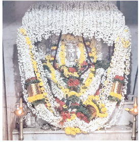
శ్రీ గురు గిరి సిద్ధేశ్వరస్వామిని ప్రత్యేక ఆలంకరణ

శివచార్యులు ఆధ్వర్యంలో స్వామి వారికి మహా రుద్రాభిషేక పూజలు భక్తిభావంతో నిర్వహించారు. కర్ణాటక తుమకూరు జిల్లా హందనకెర గ్రామంలో ఉన్న