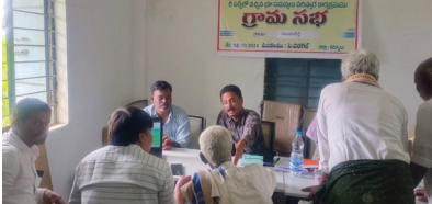
రైతుల నుండి వివరాలు స్వీకరిస్తున్న తహశీల్దార్