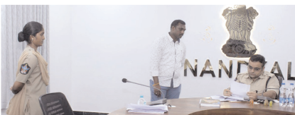
తన సమస్యలను జిల్లా ఎస్పీకి విన్నవించుకుంటున్న మహిళా కానిస్టేబుల్