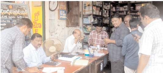
ఎరువుల దుఖాణాలను తనిఖీ విస్తున్న జిల్లా వ్యవసాయాధికారి వైవి మురళీ కృష్ణ

- నంద్యాల జిల్లా వ్యవసాయాధికారి వైవి మురళీకృష్ణ