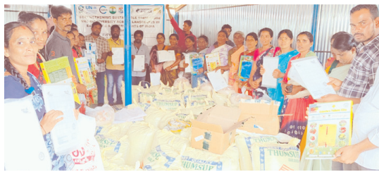
గిరిజన రైతులకు ఘన జీవామృతం, బెల్లం, శనగ పిండి పంపిణీ చేస్తున్న దృశ్యం

- 50 మంది రైతులకు ఘన జీవామృతం, బెల్లం, శనగ పిండి పంపిణీ