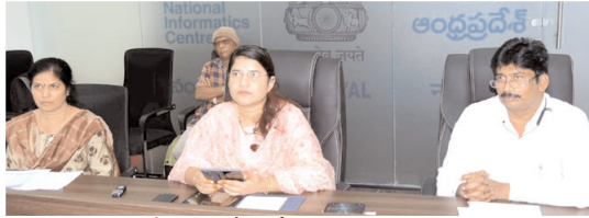
అధికారుల సమీక్ష సమావేశంలో మాట్లాడుతున్న కలెక్టర్ రాజకుమారి