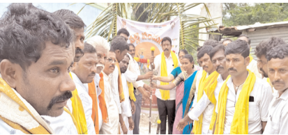
సీసీరోడ్లకు భూమి పూజ చేస్తున్న నాయకులు, అధికారులు