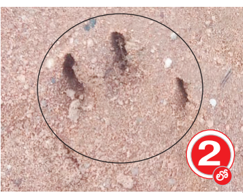
పులి సంచరించిన అడుగుల దృశ్యం