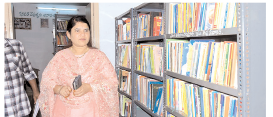
పద్మావతినగర్ లోని గ్రంథాలయంలోని పుస్తకాలను పరిశీలిస్తున్న కలెక్టర్

లేదా అని ఇన్చార్జి లైబ్రేరియన్ ను ప్రశ్నించారు. బడ్జెట్ కేటాయింపు జరిగిన వెంటనే పోటీ పరీక్షలకు అవసరమయ్యే పుస్తకాలను తెప్పించి అభ్యర్థులకు అందుబాటులో ఉంచాలన్నారు. గ్రంథాలయంలో కంప్యూటర్ సిస్టంలు కూడా తక్కువగా ఉన్నాయని ఆన్లైన్ పరీక్షలకు ప్రివేట్ కావడానికి అవసరమయ్యే కంప్యూటర్లను కూడా ఏర్పాటు చేసుకోవాలని కలెక్టర్ ఆదేశించారు. గ్రంథాలయ భవనం పాక్షికంగా దెబ్బతిందని, ఫ్లోరింగ్ కూడా మరమ్మతులు చేయాల్సి ఉందని వసులు పూర్తి చేసుకోవాలని కలెక్టర్ ఆదేశించారు.