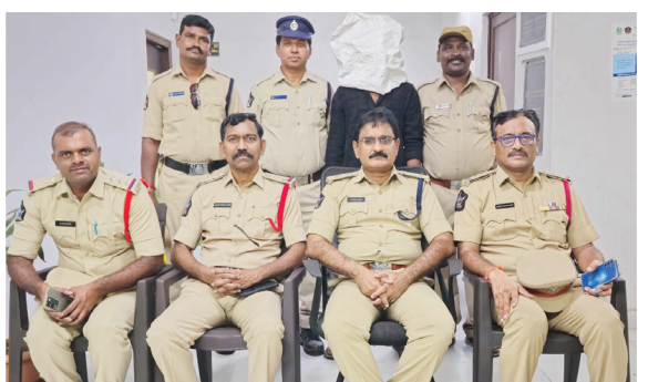
నిందితుడి అరెస్టును చూపిస్తున్న పోలీసులు