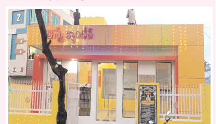
ప్రారంభానికి మున్సిపల్ అన్నా క్యాంపేన్

ఆత్మకూరు, మేజర్ న్యూస్: అతి తక్కువ ధరకే పేదల కడుపులు నింపేందుకు ప్రభుత్వం చేపట్టిన అన్నా క్యాంపేన్ ప్రారంభిస్తున్నట్లు మున్సిపల్ కమిషనర్ రమేష్ బాబు తెలిపారు. శుక్రవారం పట్టణంలోని పాతబస్టాండ్లో ఉన్న అన్నా క్యాంపేన్ ను ప్రారంభిస్తున్నామని, ఈ కార్యక్రమానికి ముఖ్య అతిథులుగా శ్రీశైలం నియోజకవర్గం శాసనసభ్యులు బుద్దా రాజశేఖర్ రెడ్డి హాజరై ప్రారంభిస్తారని కమిషనర్ తెలిపారు. అధికారులు, ప్రజాప్రతినిధులు, ప్రజలు అధిక సంఖ్యలో హాజరై ఈ కార్యక్రమాన్ని విజయవంతం చేయాలని కోరారు.