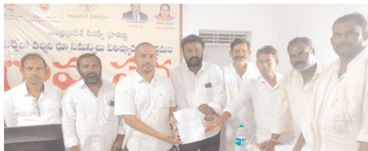
తాసిల్దార్ ఆంజనేయులుకు వినతి పత్రాలు అందజేస్తున్న పందిపాడు గ్రామ రైతులు

కల్లూరు మేజర్ న్యూస్ : గ్రామాల్లో నిర్వహిస్తున్న రెవెన్యూ సదస్సులో భూ రీ సర్వే సమస్యలను పరిష్కరించుకోవాలని కల్లూరు మండల తాసిల్దార్ కే ఆంజనేయులు రైతులకు సూచించారు శుక్రవారం కల్లూరు మండలం పందిపాడు రెవెన్యూ గ్రామంలో ఆంధ్రప్రదేశ్ రీ సర్వే ప్రాజెక్టు కార్యక్రమంలో భాగంగా రెవెన్యూ సదస్సును నిర్వహించారు. ఈ సందర్భంగా తాసిల్దార్ కే ఆంజనేయులు మాట్లాడుతూ గత ఏడాదిలో నిర్వహించిన భూ రీ సర్వే లో వచ్చిన అన్ని రకాల భూ సమస్యలను పరిష్కరించుకోవాలని అన్నారు. ప్రతి సమస్యకు ఒక దరఖాస్తు రూపొందించారని పూర్తి చేసిన దరఖాస్తు తో పాటు సమస్యకు సంబంధిత ఆధారాలను జతపరిస్తే పరిష్కారం వేగవంతం అవుతుందన్నారు బాధిత రైతులు అందించిన దరఖాస్తులను కంప్యూటర్లో నిక్షేపం చేస్తామని తెలిపారు ప్రతి దరఖాస్తుకు రసీదు ఇవ్వడంతో పాటు అందరి సహకారంతో పరిష్కరించేందుకు కృషి చేస్తామన్నారు. ఎంత కష్టతరమైన సమస్య ఉన్న రైతులు అధికారులు కూర్చునే పరిష్కరించుకుంటే భవిష్యత్తు బాగుంటుందని తెలిపారు లేనిచో సమస్యలు ఉంటే బ్యాంకు అధికారులు రుణాలు ఇవ్వడాని క్రయ విక్రయాలు జరిపేందుకు