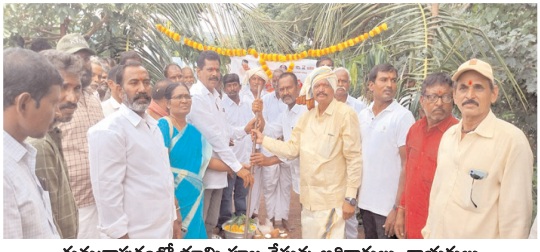
గుమ్మడాపురంలో భూమి పూజ చేస్తున్న అధికారులు, నాయకులు

కొత్తపల్లి, మేజర్ న్యూస్ : ప్రభుత్వం గ్రామాల్లో ఉన్న సిసి రహదారుల నిర్మాణాలకు నిధులు మంజూరు చేయడంతో గ్రామాలు మరింత అభివృద్ధి చెందుతాయని ఎంపీ డి.వో. మేరి తెలిపారు. శనివారం