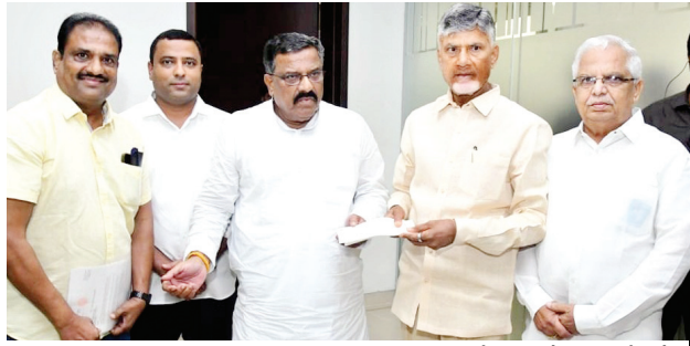
రాష్ట్ర ముఖ్యమంత్రి చంద్రబాబు నాయుడుకు చెక్కును అందజేస్తున్న డోన్ ఎమ్మెల్యే కోట్ల

డోన్, మేజర్ న్యూస్: డోన్ నియోజక వర్గం అభివృద్ధి కోసం అన్ని రకాలుగా సహకారం అందించాలని ఎమ్మెల్యే కోట్ల సూర్య ప్రకాష్ రెడ్డి ముఖ్యమంత్రి నారా చంద్రబాబు నాయుడుకు విజ్ఞప్తి చేశారు. ఆయన శనివారం అమరావతిలోని సచివాలయంలో డోన్ అభివృద్ధికి సంబంధించిన పలు ప్రతిపాదనలను అందజేశారు. ప్రధానంగా డోన్ నియోజకవర్గం నుంచి నంద్యాల, పత్తికొండ, కోడమూరు పట్టణాల వైపు రహదారులను పూర్తి స్థాయిలో అభివృద్ధి మిగతా 2లో