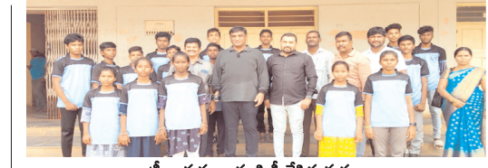
క్రీడా దుస్తులు పంపిణీ చేసిన దృశ్యం