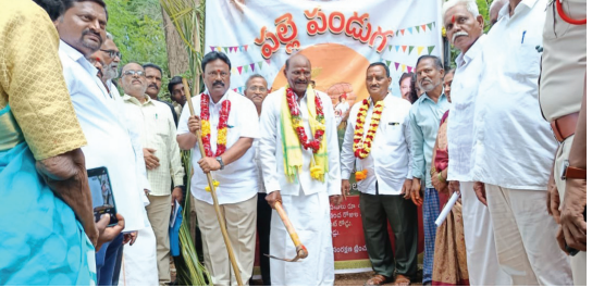
ఎర్రగుడూరు భూముక్తల గ్రామాలలో సీని రోడ్లకు భూమి పూజ