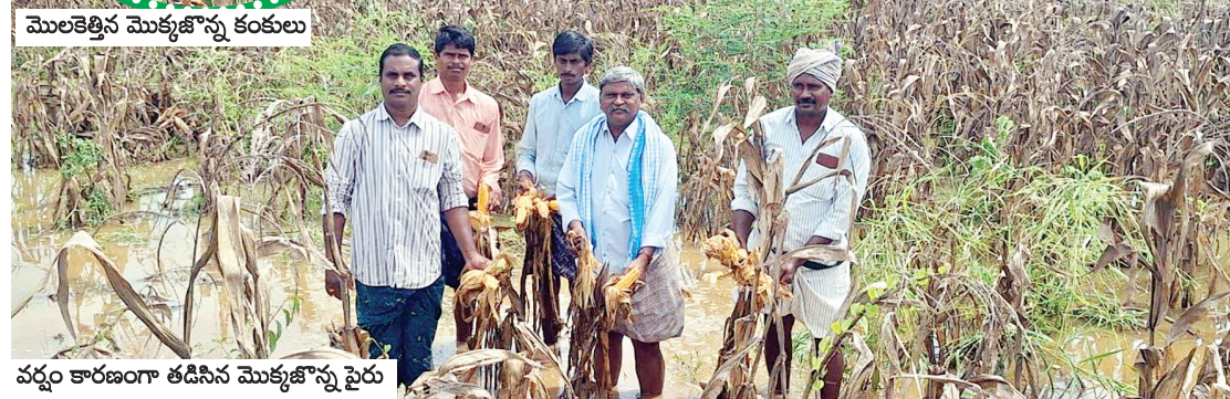
మొలకెత్తిన మొక్కజొన్న కంకులు