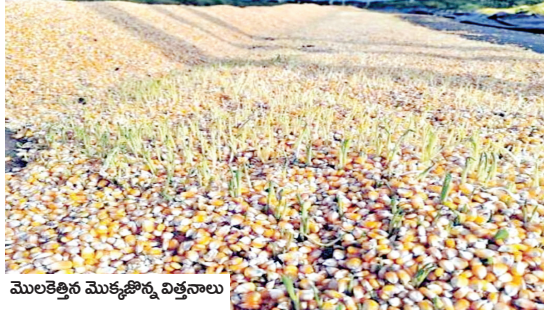
మొలకెత్తిన మొక్కజొన్న విత్తనాలు

ఆరబెట్టుకున్నారు. తుఫాను కారణంగా ధాన్యంపై టార్చులిన పట్టలు కప్పిఎన్నిజాగ్రత్తలుతీసుకున్నప్పటికీ ధాన్యం తడిసిపోయి మొలక ఎత్తడంతో మూడు నెలలపాటు శ్రమించిన రైతు కష్టం మూడు రోజులలో ఆవిరి అయిపోయింది. ప్రభుత్వం తమను ఆదు కోవాలని ఆళ్లగడ్డ ప్రాంత రైతులు కోరుతున్నారు.