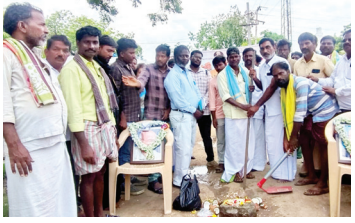
సి.బెలగల్ మేజర్ న్యూస్ : మండల పరిధిలోని గుండ్రపుల, కొండాపురం, ఈర్లదిన్నె గ్రామాలలో శనివారం పల్లె పండుగ కార్యక్రమం నిర్వహించారు. ఈ కార్యక్రమంలో ఆయా