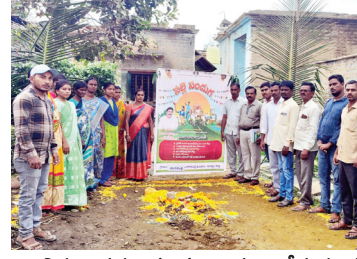
అభివృద్ధి పనులకు భూమి పూజ చేస్తున్న ద్భుక్యం

భూమి పూజలు నిర్వహించడం జరిగింది. ఈ కార్యక్రమంలో ఆయా గ్రామాల నాయకులు, కార్యకర్తలు, మండలస్థాయి అధికారులు పాల్గొన్నారు.