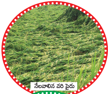
నేలవాలిన వరి సైరు