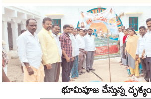
భూమిపూజ చేస్తున్న దృశ్యం