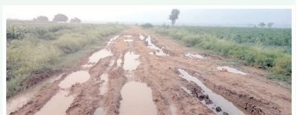
నాగరకన్య, హోస్పూర్ రోడ్డు దుస్థితి

హోళగుండ్, మేజర్ న్యూస్ : కురుస్తున్న వర్షాలకు హోస్పూర్ గ్రామ పంచాయితీలోని నాగరకన్య, హోస్పూర్, హోస్పూర్ క్యాంఫ్ గ్రామాల రోడ్డు బురదగుంటగా మారాయి. రోడ్డు దుస్థితి, ఇలా ఉంటే వాహనాలు నడిచేది ఎలా అని ఆయా గ్రామ