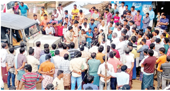
గ్రామస్థులతో మాట్లాడుతున్న సిబ్బంది