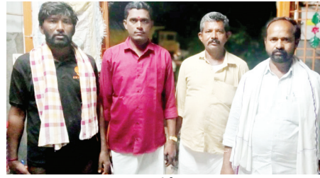
మాట్లాడుతున్న టీడీపీ నాయకులు