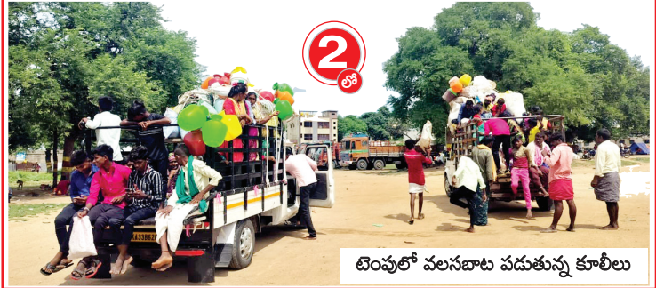
టెంపులో వలసబాట పడుతున్న కూలీలు