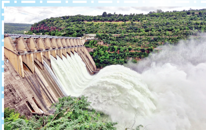
శ్రీశైలం డ్యామ్ ఆరు గేట్ల ద్వారా విడుదల అవుతున్న నీటి ధ్వజం