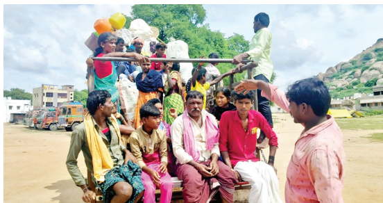
వలసబాటకు వెళుతున్న కూలీలు

కోసిగి మేజర్ న్యూస్: దాదపుగా వారంరోజులుగా వర్షాలు రాష్ట్ర వ్యాప్తంగా కురుస్తూ ఉన్నాయి. మరోపక్క వలస కూలీలు వలసబాటను పడుతూనే ఉన్నారు. ఒకపక్క వర్షాలు-మరోపక్క పక్క వలసలతో కోసిగి గ్రామంతోపాటు మండలంలో గ్రామాలు ఖాళీ అవుతున్నాయి. ఉన్న గ్రామ పొలాల్లో పనిచేయడానికి కూలీలకు ఇష్టంలేక, గిట్టుబాటుద్రలేక వేరే రాష్ట్రాలవైపు మొగ్గు చూపుతున్నారు. దీనితో ఆదివారం కోసిగి గ్రామంలోని 300కుటుంబాలకు పైగా వలసబాట పట్టడంతో రైతులు అయోమయానికి గురవుతున్నారు. మంచి వర్షాలు