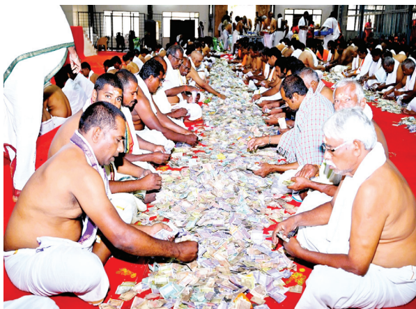
హుండి ఆదాయాన్ని లెక్కిస్తున్న దృశ్యం