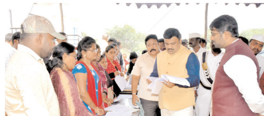
గోనెగండ్ల మండలం కున్నూరులో ప్రజల నుంచి వినతి పత్రాలను స్వీకరిస్తున్న కలెక్టర్

గోనెగండ్ల, మేజర్ న్యూస్ : రీసర్వేలు జరిగిన గ్రామాలలో భూ సమస్యలను పరిష్కరించేందుకే గ్రామ సభలు నిర్వహిస్తున్నామని అలాగే అవసరం అయితే పాలాలకు వచ్చి సర్వే చేసి అక్కడే మీ భూ సమస్యలను పరిష్కరిస్తామని జిల్లా కలెక్టర్ పీ. రంజిత్ బాషా అన్నారు. గురువారం గోనెగండ్ల మండల పరిధిలోని కున్నూరు గ్రామంలో గ్రామ సభ కలెక్టర్ రంజితబాషా, సబ్ కలెక్టర్ హార్షభరద్వాజ్ హాజరయ్యారు. గ్రామ సభలో ప్రజలు ఇచ్చే వినతి పత్రాలను వారు తీసుకున్నారు. ఈ సందర్భంగా ఆయన మాట్లాడుతూ కున్నూరు గ్రామంలో రీ సర్వే పూర్తి అయినప్పటికీ రీసర్వేకు సంబంధించి కొన్ని సమస్యలు ఉన్నట్లు మాకు తెలియడంతో గ్రామ సభ నిర్వహిస్తున్నామన్నారు. ప్రతి సోమవారం భూ సమస్యలు ఉన్న రైతులు కర్నూలు కలెక్టర్ కార్యాలయంకు రాకుండా ఆయా గ్రామాలలోనే సమస్యలు పరిష్కరించే విధంగా ఆయా గ్రామాలలో గ్రామ సభలు నిర్వహిస్తున్నామని ఈ సభలో సబ్ కలెక్టర్, ఆర్డీవో, తహసీల్దార్, సర్వేయర్ లాంటి అధికారులు పాల్గొని రైతుల సమస్యలను పరిష్కరిస్తారన్నారు. భూములు సాగు చేసుకుంటున్న వారి వివరాలను అన్ని జాగ్రత్తగా పరిశీలిస్తున్నట్లు ఆయన తెలిపారు. భూమి విస్తీర్ణంలో కొంత మందికి ఎక్కువ మరీ కొంత మందికి