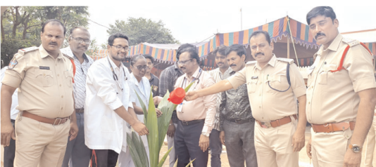
ప్రభుత్వ ఆసుపత్రి ఆవరణలో మొక్కలు నాటుతున్న దృశ్యం