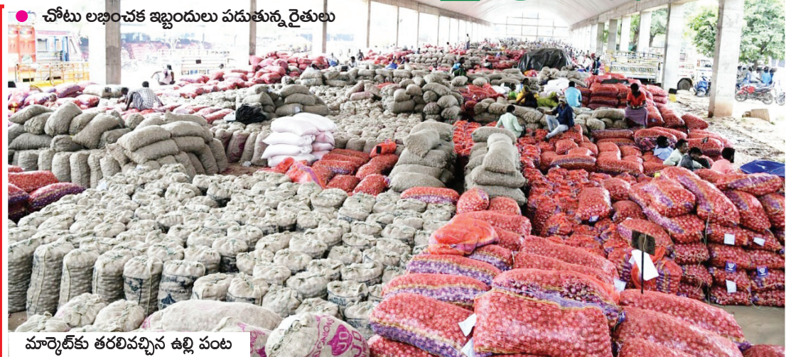
మార్కెట్ కు తరలివచ్చిన ఉల్లి పంట

కర్నూలు టౌన్, మేజర్ న్యూస్: కర్నూలు మార్కెట్ యార్డుకు గత రెండురోజులుగా ఉల్లి పంట అధికంగా తరలివస్తోంది. ఉల్లికి మంచి రేటు ఉండటంతో రైతులు తమ ఉత్పత్తులను కర్నూలు మార్కెట్ యార్డుకు తరలిస్తున్నారు. గత వారంరోజులుగా వర్షాలు బాగా పడుతుండడంతో ఉల్లికి మంచి ధర ఉందన్న ఉద్దేశ్యంతో పంటను పొలాల్లో ఉంచకుండా రైతులు పంటను కోసి మార్కెట్ కు తరలిస్తున్నారు. గురువారం ఒక్కరోజే 75వేలకిలోగ్రాముల ఉల్లి పంటను రైతులు కర్నూలు మార్కెట్ యార్డుకు తీసుకవచ్చారు. పంట అధికంగా తరలిస్తుండటంతో యార్డులో ఉంచడానికి స్థలం కరువైంది. దీంతో రైతులు ఆందోళన వ్యక్తం చేస్తున్నారు. అదే విధంగా ఉల్లికి మంచి గిట్టుబాటు ధర ఉండటంతో రైతులు తమ పంటను ఇప్పుడే విక్రయించుకుంటే బాగుంటుందని పంటను తరలిస్తున్నామని పలువురు రైతులు తెల్పుతున్నారు. మార్కెట్ యార్డు అధికారులు వ్యాపారులతో మాట్లాడి తమకు న్యాయం చేయాలని పలువురు ఉల్లి రైతులు కోరుతున్నారు. మార్కెట్ యార్డులో రైతులు తీసుకొని వచ్చిన ఉల్లి పంటలను ఉంచడానికి స్థలం లేకపోవడంతో మార్కెట్ యార్డు అధికారులు ఇబ్బందులు ఎదురుకుంటున్నారు. మిగతా 2లో