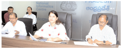
అధికారుల సమీక్ష సమావేశంలో మాట్లాడుతున్న కలెక్టర్