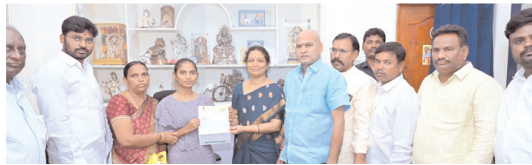
చెక్కులను అందజేస్తున్న దృశ్యం