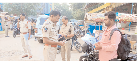
సోదాలు నిర్వహిస్తున్న దృశ్యం