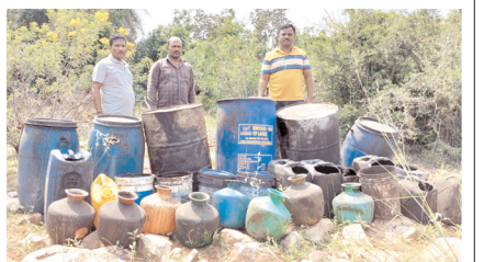
బెల్లం ఊటను ధ్వంసం చేస్తున్న దృశ్యం