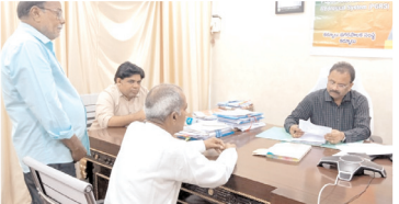
అట్టలు స్వీకరిస్తున్న కమిషనర్

కర్నూలు నగరం, మేజర్ న్యూస్: నగరంలో మౌలిక సదుపాయాల కల్పనపై ప్రత్యేక దృష్టి సారించి, అత్యవసర పనులకు