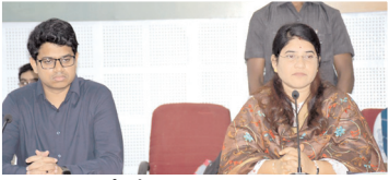
అధికారులతో సమీక్షిస్తున్న కలెక్టర్, జాయింట్ కలెక్టర్

నంద్యాల కలెక్టర్, మేజర్ న్యూస్ : రుద్రవరం మండలంలో పారిశుధ్య చర్యలు ముమ్మరం చేయడంతో పాటు క్లోరినేట్ చేసిన నీటినే సరఫరా చేసి దయ్యిరియను నియంత్రణలోకి తీసుకుని రావాలని జిల్లా కలెక్టర్ రాజకుమారి ఎంపీ డి.ఓ., గ్రామీణ నీటి సరఫరా ఇంజనీరింగ్ అధికారులను ఆదేశించారు. సోమవారం కలెక్టరేట్ కార్యాలయంలో నైపుణ్య గణన తదితర అంశాలపై అధికారులతో సమీక్షించారు. ఈ సందర్భంగా కలెక్టర్ మాట్లాడుతూ ప్రజలకు సురక్షిత మంచినీటి సరఫరా చేయడంలో ఎందుకు విఫలమవుతున్నారని కలెక్టర్ అధికారులను ప్రశ్నించారు. రుద్రవరం మండలంలో ఆర్డర్ బుక్ చేసిన అధికారులు ఖచ్చితమైన సురక్షిత నీరు అందించడంలో నిర్లక్ష్యం చేస్తున్నారని కలెక్టర్ అసంతృప్తి వ్యక్తం చేశారు. ప్రభుత్వం ప్రతిష్టాత్మకంగా తీసుకున్న నైపుణ్య గణన శిక్షణా కార్యక్రమాన్ని మంగళవారం పీజీఆర్ఎస్ హోల్ లో ఏర్పాటు చేశామని ఇందుకు సంబంధించి ప్రతి మున్సిపాలిటీ, అన్ని మండలాల నుంచి ప్రతిభగల ఇద్దరు డిజిటల్ అసిస్టెంట్లు శిక్షణా కార్యక్రమానికి హాజరయ్యేలా చర్యలు తీసుకోవాలన్నారు. ఈనెల 31వ తేదీన ప్రభుత్వ సెలవు దినం అయినందున 30వ తేదీన ఎన్టీఆర్ భరోసా పెన్షన్ మొత్తాన్ని డ్రా చేసుకుని నవంబర్ 1వ తేదీన లబ్ధిదారులకు పంపిణీ చేసేందుకు సిద్ధంగా ఉండాలని కలెక్టర్ ఆదేశించారు. పల్లె పండుగలో శంకుస్థాపన చేసిన సీసీ రోడ్ల పనుల నాణ్యతలో రాజీ పడకుండా నిర్మాణ పనులు చేపట్టాలన్నారు. చేపట్టిన నిర్మాణ పనులను క్వాలిటీ కంట్రోల్ బృందాలతో తనిఖీలు చేయాలని కలెక్టర్ తెలిపారు. ఓటర్ల జాబితా సవరణకు సంబంధిత ఈనెల 29వ తేదీన డ్రాఫ్ట్ రోల్ జాబితాను పబ్లిష్ చేయాలన్నారు. కలెక్టరేట్ ఏఓ రవికుమార్ అవినీతి నిర్మూలనపై అధికారులచే ప్రతిజ్ఞ చేయించారు.