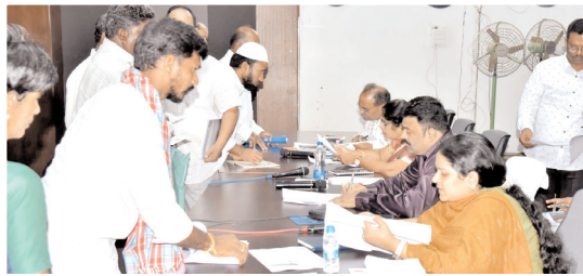
అర్జీలు స్వీకరిస్తున్న దృశ్యం

కర్నూలు, మేజర్ న్యూస్ ప్రతినిధి: ప్రజా సమస్యల పరిష్కార వేదికకు వచ్చే అర్జీల పరిష్కారంలో గడువు దాటితే చర్యలు తప్పవని జిల్లా కలెక్టర్ పి.రంజితబాబు అధికారులను అడిగించారు. సోమవారం కలెక్టర్ ఆఫీసులో సుసయన ఆడిటోరియంలో ప్రజా సమస్యల పరిష్కార వేదిక కార్యక్రమం ద్వారా జిల్లా కలెక్టర్ ప్రజల నుంచి వినతులు స్వీకరించారు. ఫిర్యాదుల స్వీకరణ అనంతరం కలెక్టర్ ఫిర్యాదుల పరిష్కారంపై అధికారులతో సమీక్షించారు. ఈ సందర్భంగా ఆఫీసులో నీటి సరఫరాకు సంబంధించి వచ్చిన అర్జీ పరిష్కారంలో గడువు దాటడంపై కలెక్టర్ ఆఫీసు మున్సిపల్ కమిషనర్పై ఆగ్రహం వ్యక్తం చేశారు. ప్రజా ఫిర్యాదుల పరిష్కారంలో గడువు దాటకూడదని ఎన్నోసార్లు సమావేశాల్లో, వీడియో కాన్ఫరెన్స్ లో చెప్పినప్పటికీ మళ్లీ గడువు దాటిన తర్వాత అర్జీ పరిష్కారించడం ఏంటి అని కలెక్టర్ ఆగ్రహం వ్యక్తం చేశారు. ఇందుకు కారణమైన సంబంధిత సెక్టరీయల్ సిబ్బందిపై చర్యలు తీసుకోవాలని కలెక్టర్ మున్సిపల్ కమిషనర్ ను అడిగించారు. అర్జీల పరిష్కారంలో గడువు దాటితే సహించేది లేదని కలెక్టర్ స్పష్టం చేశారు. లాగిన్ లో అర్జీలను ఓపెన్