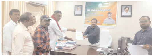
వినతిపత్రం అందజేస్తున్న దృశ్యం

ఏర్పడిందని ఆవేదన వ్యక్తం చేశారు. రాత్రి వేళల్లో విషపురుగులు రోడ్డుపై తిరుగుతున్నాయని, కాలువలు లేకపోవడంతో మురికినీరు