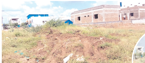
అన్యాయతపై పార్కు స్థలం

- దురాక్రమణ కాకుండా కాపాడాలంటూ కాలనీవాసుల విసతి