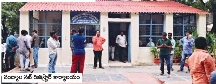
నంద్యాల సబ్ రిజిస్ట్రార్ కార్యాలయం

నంద్యాల, మేజర్ న్యూస్ బ్యూరో : నంద్యాల సబ్ రిజిస్ట్రార్ కార్యాలయం మరో వివాదానికి కేంద్ర బిందువుగా మారింది. కార్యాలయం కేంద్రంగా ఎన్నో ఏళ్ళుగా స్టాంప్ రైటర్లుగా పని చేస్తున్న వారు రెండు వర్గాలుగా చీలిపోయారు. సాధారణ బదిలీలపై నంద్యాల సబ్