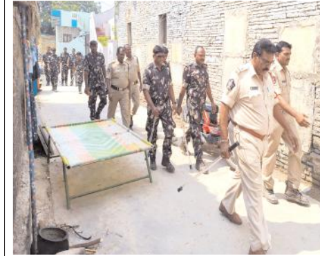
కవాతు నిర్వహిస్తున్న పోలీసులు