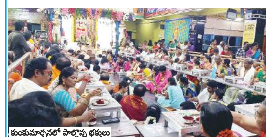
కుంతూరులో పాల్కొన్న భక్తులు

కర్నూలు కల్చరల్, మేజర్ న్యూస్: దేవి శరన్నవరాత్రు ఉత్సవాల్లో భాగంగా సోమవారం నగరంలోని అమ్మవారి ఆలయాలు భక్తులతో కిటకిటలాడాయి. 5వరోజు అమ్మవారు శ్రీచండీదేవి అలంకరణలో భక్తులకు దర్శనమిచ్చారు. అమ్మవారిని దర్శించుకుకొని భక్తులు క్యా లైన్లో భారులు తీరారు. లోక కంటాకులైన రాక్షసులను