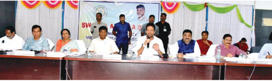
సమావేశంలో మాట్లాడుతున్న రాష్ట్ర మంత్రి టీ.జి. భరత్