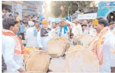
బిరప్ప డోళ్ళతో గ్రామంలో నందడి

హాళగుండ్, మేజర్ న్యూస్: హాళగుండ్ మండలం దేవరగట్టు మాళమల్లేశ్వరస్వామి వార్లకు సోమవారం కంకణధారణ కార్యక్రమాన్ని వైభవంగా నిర్వహించారు. నెరణికి గ్రామంలో ఉన్న స్వామి వారి ఉత్సవ విగ్రహాలు, పల్లకికి భక్తులు విశేషంగా పూజలు చేశారు. బిరప్ప డోళ్ళను కొట్టుకుంటు గ్రామంలో నందడి