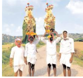
స్వామి వారి విగ్రహాలను మోసుకెళ్తున్న దృశ్యం

చేశారు. అనంతరం కంచాబీర వంశానికి చెంది గౌరవయులు స్వామి వారి విగ్రహాలను, పల్లకిని దేవరగట్టు కొండలో ఉన్న దేవాలయానికి మోసుకెళ్ళారు. నియమ నిష్ఠతో ఉన్న భక్తులు, గ్రామానికి చెందిన వేదపండితుల ద్వారా మల్లేశ్వర, మాళమ్మ దేవికి కంకణధారణ కార్యక్రమాన్ని నిర్వహించారు. దింతో దేవరగట్టు విజయదమి ఉత్సవాలు ప్రారంభం అయ్యాయి. కార్యక్రమంలో ఎలాంటి అవాంఛనీయ సంఘటనలు జరగకుండా పోలీసులు బంధోబస్తును నిర్వహించారు. నెరణికి, నెరణికి తాండ, కొత్తపేట గ్రామానికి చెంది కమిటీ సభ్యులు, భక్తులు పాల్గొన్నారు.