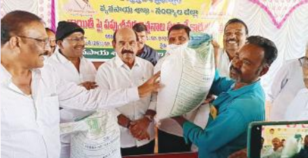
రైతులకు రాయిటీ విత్తనాలను పంపిణీ చేస్తున్న మంత్రి ఫరూక్

నంద్యాల కల్చరల్, మేజర్ న్యూస్ : నంద్యాల పట్టణంలోని టెక్నో మార్కెట్ యార్డ్లో వ్యవసాయశాఖ ఆధ్వర్యంలో రైతులతో లో ముఖ్య అతిథిగా న్యాయశాఖ మంత్రి ఫరూక్ చేతుల మీదుగా రైతులకు రాయిటీపై పప్పు శనగ విత్తనాల పంపిణీ జరిగింది. నంద్యాల మండలానికి 186క్వింటాళ్ళు జిజి11 రకం శనగ విత్తనాలు కేటాయించడం జరిగింది. ఈవిత్తనాలను గుంతనాల, మిట్టూల, పుసులూరు, పులిమద్ది, భీమవరం, ఊడుమాల్యురం, మూలసాగరం గ్రామాలకు కేటాయించడం