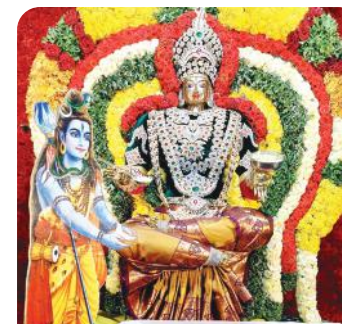
శ్రీఅన్నపూర్ణదేవి అలంకరణలో అమ్మవారు

నంద్యాల కల్చరల్, మేజర్ న్యూస్ : దేవి శరన్నవరాత్రు ఉత్సవాలలో దేవి మమ్మల్ని అనుగ్రహించండి.. శరణు..శరణు తల్లీ అంటూ భక్తులు శ్రీజగజ్జననీ మాతకు భక్తి శ్రద్ధలతో పూజలు చేస్తూ తమ మొక్కులు చెల్లించుకుంటున్నారు. దేవి శరన్నవరాత్రు ఉత్సవాలలో జగన్మాత వివిధ రూపాల్లో భక్తులకు దర్శనమిస్తు తన భక్తుల మనోవాంఛలను తీరుస్తుంది. పట్టణంలోని ఆలయాల్లో అమ్మవారికి నీరాజనాలు