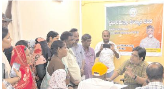
వినతులు స్వీకరిస్తున్న దృశ్యం