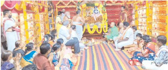
పూజలు నిర్వహిస్తున్న దృశ్యం

మహానంది, మేజర్ న్యూస్: మహానంది పుణ్యక్షేత్రంలో దసరా శరన్నవరాత్రి మహాత్సవాలలో భాగంగా 5వ రోజున శ్రీ కామేశ్వరి అమ్మవారు స్వంద మాత దుర్గా అవతారంలో భక్తులకు దర్శనమిచ్చారు. సోమవారం వేద పండితుల వేద మంత్రాలతో మూల విరాళితో శ్రీ కామేశ్వరి సమేత మహానందిశ్వర స్వామివార్లకు విశేష ద్రవ్య అభిషేకార్చనలను నిర్వహించారు. అనంతరం ప్రత్యేక యాగశాలలో నేటి ఉభయ దాతలను కంకణధారులను చేసి విశేష పూజలు నిర్వహించారు. గణపతి, నవగ్రహ రుద్ర