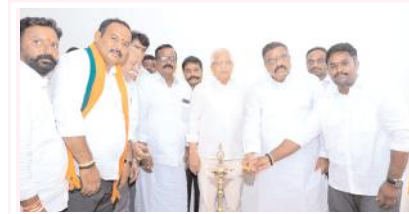
క్యాంపు కార్యాలయాన్ని ప్రారంభిస్తున్న ఎమ్మెల్యే కోట్ల, కూటమి నాయకులు

కోట్ల, మేజర్ న్యూస్: కోట్ల ఎమ్మెల్యే క్యాంపు కార్యాలయాన్ని సోమవారం ఎమ్మెల్యే, టి.డి.పి జాతీయ ఉపాధ్యక్షులు కోట్ల జయసూర్యప్రకాశ్ రెడ్డి చేతుల మీదుగా ప్రారంభించారు. ఈ కార్యక్రమానికి కూటమి నాయకులు, కార్యకర్తలు పాల్గొన్నారు.