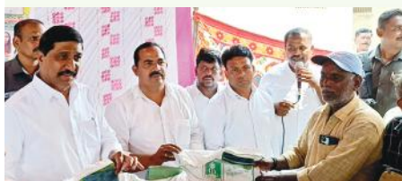
శనగ విత్తనాలు పంపిణీ చేస్తున్న మంత్రి బి.సి

బనగానపల్లెమేజర్, న్యూస్: సోమవారంనాడు బనగానపల్లె పట్టణంలోని వ్యవసాయశాఖ కార్యాలయం నందు ఆ శాఖ అధికారుల ఆధ్వర్యంలో చేపట్టిన శనగ విత్తనాల పంపిణీ కార్యక్రమంలో రాష్ట్ర రోడ్డు భవనాలు, పెట్టుబడులు, మౌలిక పనుల శాఖ మంత్రి బి.సి జనార్ధన్ రెడ్డి హాజరై రైతులకు శనగ విత్తనాలను పంపిణీ చేశారు. ఈ సందర్భంగా వారు మాట్లాడుతూ రాష్ట్ర ప్రభుత్వం పెద్ద ఎత్తున చేపడుతున్న విత్తన పంపిణీ కార్యక్రమాన్ని సద్వినియోగం చేసుకొని వ్యవసాయాన్ని లాభనోటిగా చేసుకోవాలని అన్నార. అర్హులైన రైతులందరికీ నాణ్యమైన శనగవిత్తనాలను