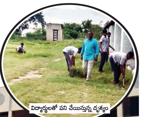
విద్యార్థులతో పని చేయిస్తున్న దృశ్యం