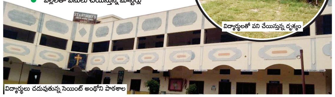
విద్యార్థులు చదువుతున్న సెయింట్ అంథోని పాఠశాల