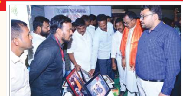
భవిష్యత్తులో కూడా అనేక ఉద్యోగాలు కల్పిస్తామని తెలియజేశారు. నాగర్ కర్నూల్ పార్లమెంట్ నిరుద్యోగ యువతను వ్యాపారవేత్తలుగా మార్చే విధంగా మూడు జిల్లాల కలెక్టర్లు సహాయ సహకారాలు అందించాలని కోరారు. నెల రోజుల తర్వాత డిసిసిబి బ్యాంక్ ఆధ్వర్యంలో 150 కోట్ల మిగతా 2లో

ప్రభుత్వాల ద్వారా అమలు అయ్యే అన్ని రకాల సంక్షేమ పథకాలను నాగర్ కర్నూల్ పార్లమెంట్ నియోజకవర్గం ప్రజలు ఉపాధి అవకాశాలను పెంపొందించు కునే విధంగా అవగాహన కార్యక్రమం ఏర్పాటు చేయడం జరిగిందని, దేశంలోని వివిధ రకాల బ్యాంకులో అందిస్తున్న రుణాలు సబ్సిడీలు ప్రజలకు తెలిసి విధంగా బ్యాంక్ అధికారులచే స్థానిక యువతకు అవగాహన కల్పించామని తెలిపారు. సూక్ష్మ చిన్న తరహా మధ్య తరహా పరిశ్రమలను స్థాపించడానికి కావలసిన వనరులు నైపుణ్యాలు పెట్టుబడి పలు అంశాలపై ఈ కార్యక్రమంలో అవగాహన కల్పించారు. డిగ్రీ పూర్తి చేసిన యువత సెల్ఫీ ఎంప్లాయిమెంట్ దిశగా ప్రయత్నాలు ప్రారంభించాలని, ప్రభుత్వ ఉద్యోగంతో పాటు ప్రైవేటు ఉద్యోగాలు కూడా అనేకం ఉన్నాయని, నిత్యం తమ యొక్క నైపుణ్యాలను అభివృద్ధి చేసుకుంటూ ఉన్నత స్థానాలకు చేరాలని ఆకాంక్షించారు. తమ ప్రభుత్వం ఇప్పటికే 50 వేల ఉద్యోగాలు కల్పించిందని వీటిలో టీచర్లు ఏఎన్ఎంలు లాంటి ఉద్యోగాలు ఉన్నాయని