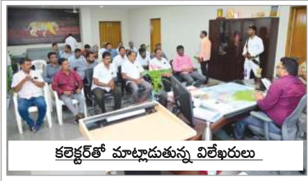
కలెక్టర్తో మాట్లాడుతున్న విలేఖరులు