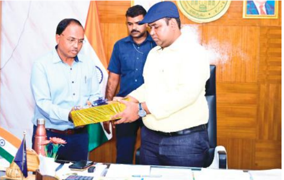
మెడక్ మేజర్ న్యూస్ ప్రతినిధి...ఆర్థిక వృద్ధి, సామాజిక అభివృద్ధి, కీలక