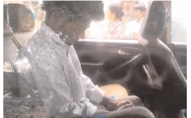
పోలీసుల అదుపులో ఒరిస్సా రాష్ట్రానికి చెందిన నిందితుడు

మత్తులో రావల్ కోల్ గ్రామం : మేడ్చల్ మండలంలోని రావల్ కోల్ గ్రామం యువత మత్తులో జోగుతుంది. మత్తుకు బానిసైన యువత ఎప్పుడు ఏం చేస్తున్నారో తెలియక ఒళ్లు మర్చిపోయి హత్య చేసే స్థాయికి ఎదిగారు. ఒరిస్సా రాష్ట్రం నుంచి ఉపాధి కొరకు గత 15 సంవత్సరాల క్రితం రావల్ కోల్ గ్రామానికి వలస వచ్చిన ఓ యువకుడు తన