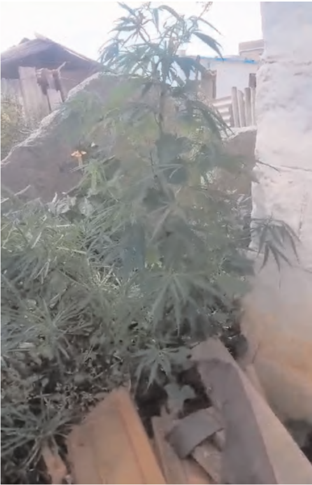
రావల్ కోల్ గ్రామంలో ఇంటి వద్ద పెంచిన గంజాయి మొక్కలు

యువత పెడదారి పడుతోంది. గంజాయి పీలుస్తూ యువత నిత్యం మత్తులో జోగుతోంది. అలవాటు లేని అమాయకులను సైతం గంజాయికి బానిసలా మార్చి సొమ్ము చేసుకుంటున్న కొంతమంది స్వార్థపరుల వల్ల అమాయకుల జీవితాన్ని చేతులారా నరక కూపంలోకి నెడుతున్న వైనంతో నేడు ఒక ప్రాంతాన్నే కాదు.. మండలంలోని అన్ని గ్రామాల్లో వెలుగు చూస్తూ యువత జీవితాలను చీకటిమయం చేస్తోంది. గంజాయి, అక్రమ మద్యం అరికట్టడంలో ప్రేక్షక పాత్ర పోషిస్తున్న మేడ్చల్ ఎక్సైజ్ పోలీసులపై చర్యలు తీసుకోవాలని పలు గ్రామాల ప్రజలు కోరుతున్నారు