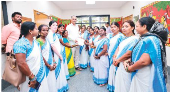
సభ్యులతో సంతోషంగా జరుపుకుంటుంటే, ఆశావర్కర్ల కుటుంబాల్లో ఆవేదన చెందడం బాధాకరమన్నారు. పండుగ పూట ఆడబిడ్డలను కంటతడి పెట్టించకుండా, వెంటనే వారికి జీతాలు చెల్లించాలని ఈ ప్రభుత్వాన్ని డిమాండ్ చేశారు.

సిద్దిపేట ప్రతినిధి, మేజర్ న్యూస్: వేతనాలు సకాలంలో రాకపోవడంతో పండుగ పూట జీతాలు ఎప్పుడు వస్తాయో అని వేచి చూస్తున్నామని, కుటుంబ సభ్యులతో ఆనందంగా గడపాల్సిన సమయంలో ఇబ్బందులు పడుతున్నామని ఆశావర్కర్లు మాజీ మంత్రి, స్థానిక ఎమ్మెల్యే హరీష్ రావు తో మంగళ వారం రోజున చెప్పుతూ వారి గోడును వెళ్లబోసుకున్నారు. ఈ సందర్భంగా ఆయన మాట్లాడుతూ కాంగ్రెస్ పార్టీ అధికారంలోకి వచ్చిన తర్వాత ఉద్యోగులందరికీ ప్రతి నెల ఒకటో తేదీన జీతాలు ఇస్తామని చెప్పిన రేపంత్ రెడ్డి, సీఎం సీటులో కూర్చున్న తర్వాత ఆ మాటలన్నీ మర్చిపోయారని అన్నారు. ఒకటో తేదీన రావాల్సిన జీతాలు 8వ తేదీ వచ్చినా ఇవ్వకపోవడం దుర్మార్గమని మండిపడ్డారు. తెలంగాణలో ఆడపడుచులు ఎంతో ఘనంగా జరుపుకునే బతుకమ్మ, దసరా పండుగ పూట ఆశావర్కర్లకు వేతనాలు చెల్లించకుండా ఇబ్బంది పెట్టడం పద్ధతి కాదని అన్నారు. తెలంగాణ అభివృద్ధిలో, సంక్షేమంలో తమ వంతు కృషి చేస్తున్న ఆశావర్కర్లను ప్రభుత్వం నిర్లక్ష్యం చేయడం శోచనీయమన్నారు. దసరా పండుగను కుటుంబ