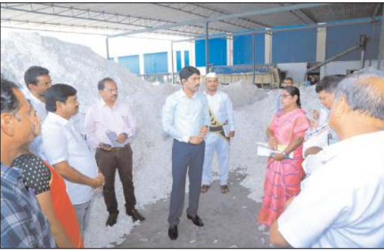
నల్గొండ జిల్లా బ్యూరో