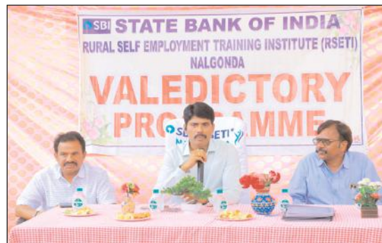
నల్గొండ జిల్లా బ్యూరో