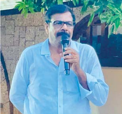
చర్యల్లో ముమ్మరంగా పాల్గొనవలసిందిగా కోరుతున్నానన్నారు.

మత్తంగా ఉండి అవసరమైతే తప్ప బయటకు వెళ్లకుండా ముఖ్యంగా చెట్టు కింద, కరెంటు స్తంభాల కింద ఉండకుండా ఇంట్లోనే సురక్షితంగా ఉంటూ జాగ్రత్తలు వహించాలని ముఖ్యంగా పల్లె ప్రాంతం ప్రజలు, మత్స్యకారులు ఈ సమయంలో కాలువలో చెరువుల్లో వేటకు వెళ్లకుండా అప్రమత్తంగా ఉండే సురక్షిత ప్రాంతాల్లో ఉండాలని కోరడమైనది అదేవిధంగా నెల్లూరు రూరల్ నియోజకవర్గంలో వైఎస్ఆర్ కాంగ్రెస్ పార్టీ కార్యకర్తలు, డివిజన్ ఇన్చార్జీలు, గ్రామ ముఖ్య నాయకులు, కార్యకర్తలు ప్రజలకు అందుబాటులో ఉండి తుఫాను ప్రభావం వల్ల ప్రజలకు ఏవైనా ఇబ్బందులు ఏర్పడితే మీరందరూ అందుబాటులో ఉండి, సహాయకి