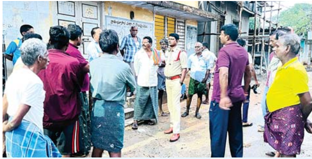
● ప్రజల్లో హర్షం ● తీరంలో ఆందోళనకరం

ఆత్మకూరు, మేజర్స్ న్యూస్ : ఆత్మకూరు పట్టణంలో, మండలంలో, డివిజన్లో సోమవారం ఓ మోస్తరు వర్షం కురవగా ఖరీఫ్ పంట సాగు చేసిన రైతులు నష్టపోయే పరిస్థితి ఏర్పడగా, ప్రజలు హర్షిస్తుండగా పెన్నానదీ పరీవాహక గ్రామాల్లో ఆందోళన వ్యక్తమవుతోంది. తుఫాన్, వరదల సమయంలో కూడా ఆత్మకూరు ప్రాంతంలో సక్రమంగా వర్షం కురిసే పరిస్థితి లేకపోగా ఈ దహా మాత్రం సోమవారం తెల్లవారుఝము నుండి ఓ మోస్తరు వర్షం ఎడతెరిపి లేకుండా కురుస్తోంది. రోడ్డు జలమయమై జనజీవనం ఇబ్బందికరంగా మారింది. బంగాళాఖాతంలో ఏర్పడిన వాయుగుండం అల్ప పీడనంగా మారి నాలుగు రోజులు ఓ మోస్తరు నుండి భారీ వర్షాలు కురుస్తాయని హెచ్చరికలు చేస్తున్నారు. డివిజన్లోని చిన్నా, పెద్దా వాగులు పొంగి తీర ప్రాంతాల్లో ఇళ్ళు జలమయ్యే పరిస్థితి ఏర్పడగలదని ఆందోళన చెందుతున్నారు. పంట దశలో ఉన్న పరి దెబ్బతింటుందని రైతులు ఆందోళన చెందుతున్నారు. సోమవారం డివిజన్ లోని సీతారామాపురం మండలంలో 15. మిల్లీ మీటర్లు, మర్రిపాడు మండలంలో 23.2, చేజర్ల