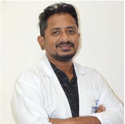
ఆస్టియోపోరోసిస్ పై మెడికల్ అవగాహన