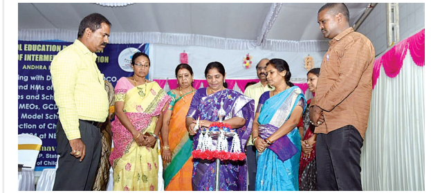
(మొదటి పేజీ తరువాయి)

ఉపాధ్యాయులదని, ఈ క్రమంలో బాలల హక్కులను పరిరక్షించే ప్రధాన భూమిక వారిదేనన్నారు. పిల్లలను ఒత్తిడికి గురి చేయకుండా చదువుతోపాటు క్రీడలు, నాయకత్వ లక్షణాలు, సృజనాత్మకత పెంపొందించే విధంగా తయారు చేయాలన్నారు. మార్కులు కానీ, మరేతర విషయాల్లో పిల్లలను ఇతరులతో పోల్చకుండా కేవలం వారి వ్యక్తిగత సామర్థ్యాల మేరకు రాణించే విధంగా తీర్చిదిద్దాలన్నారు. చిన్న వయసులోనే చదువుల ఒత్తిడికి తట్టుకోలేక ఆత్మహత్యలు చేసుకుంటున్న పిల్లలను చూస్తున్నామన్నారు. చదువుంటే కేవలం ఇంజనీరు, డాక్టరు మాత్రమే కాదని, ఇతర అనేక రంగాల్లో మంచి మంచి అవకాశాలు ఉన్నాయని, స్కూల్ వయసులోనే పిల్లలకు అవగాహన కలిగించాలన్నారు. అదేవిధంగా పాఠశాలల్లో కంప్యూటర్ బాక్స్ లను కేవలం