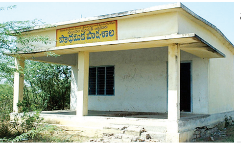
సాతానుపల్లి పునరావాస ప్రతిపాదిత స్థలంలో నిర్మించిన పాఠశాల భవనం

దృష్టికి తీసుకెళ్ళగా, ఆయన జిల్లా అధికారులతో మాట్లాడి.. భూమి కొనుగోలు పథకం ద్వారా ఒక రైతుకు చెందిన భూమిని కొనుగోలు చేయించి సాతాను పల్లికి చెందిన ఎస్పీ, బీసీలు దాదాపు వంద మందికి ఇంటి నివేళన స్థల పట్టాలిచ్చారు. ఆ స్థలం వద్దకు వెళ్ళే మార్గంలో అప్పట్లో దాదాపు రూ.2 లక్షలతో రోడ్డు నిర్మించారు. ఈ మార్గంలో కాలువ ఉండగా, దాదాపు రూ.2 లక్షలతో కల్వర్టు నిర్మించారు. పునరావాస ప్రతిపాది త స్థలంలో ప్రభుత్వం రూ.3 లక్షల వ్యయంతో పాఠశాల భవనం నిర్మించారు. అప్పటి ఎంపీ ఉక్తాల రాజేశ్వరమ్మ తమ నిధులు రూ.8 లక్షలు కేటాయించగా, ఒక కమ్యూనిటీ హాలు నిర్మించారు. అయితే ఇంతగా చేసిన ప్రభుత్వం.. వారికి ఇళ్ళు మాత్రం కేటాయించలేదు. పెద్ద సంఖ్యలో ఇళ్లు మంజూరు సాధ్యం కావడం లేదని నాయకులు కూడా చేతులెత్తేశారు. దాంతో ఐదారేళ్ళు పునరావాసం ఊసే