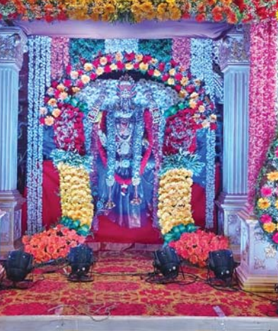
ఆత్మకూరు, మేజర్స్ న్యూస్ : ఆత్మకూరు పట్టణం లోని శ్రీ వాసవీకన్యకాపరమేశ్వరి కోదండరామ