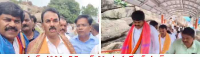
ఆర్కూర్ ప్రతినిధి, సెప్టెంబర్ 30, సూర్య మేజర్ స్కూల్స్