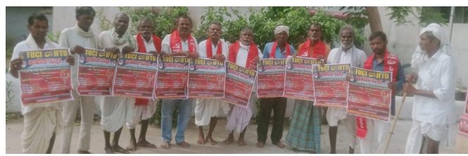
ఆవిష్కరణ చేపడుతున్న దృశ్యం

ఈనెల 20వ తేదీన హైదరాబాదులో నిర్వహించే విలీన సభను విజయ వంతం చేయాలంటూ గోడ పత్రాల ఆవిష్కరణను చేపట్టినట్లు నాయకులు పార్వతి రాజేశ్వర్ తెలిపారు. గురువారం రెంజల్ మండలంలోని బోర్లం గ్రామంలో విలీన సభ గోడప పత్రాల ఆవిష్కరణ చేపట్టారు. ఈ సందర్భంగా మాట్లాడుతూ మోడీ నాయకత్వంలోని కేంద్ర ప్రభుత్వం గత పదేళ్ళుగా కార్మిక వ్యతిరేక విధానాలను వేగంగా అమలు చేస్తుందన్నారు. దేశ సంపదను, కార్మికుల జీవితాలను కార్పొరేట్ కంపెనీలకు తాకట్టు పెడుతుందన్నారు. ఈ నేపథ్యంలోనే ఇప్పటికే 14