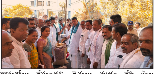
కొనుగోలు చేస్తుందని, రైతులు శుభ్రం చేసి పొల్లు లేకుండా, తేమ 17% లోపు ఉండేలా కొనుగోలు కేంద్రాలకు తీసుకువచ్చి ప్రభుత్వ మద్దతు ధర పొందాలని తెలియజేశారు. ఈ కార్యక్రమంలో ప్రాథమిక వ్యవసాయ సహకార సంఘాల అధ్యక్షులు, ప్రజాప్రతినిధులు, నాయకులు, అధికారులు, రైతులు పాల్గొన్నారు.