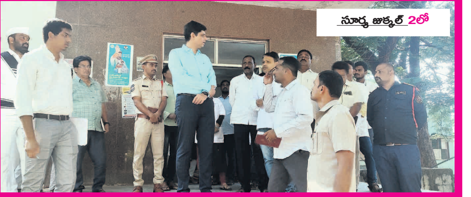
సూర్య జాక్వెట్ 2లో