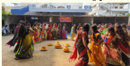
సాయికీర్తి జూనియర్ కళాశాల ఆధ్వర్యంలో..

కామారెడ్డి జిల్లా ప్రతినిధి, అక్టోబర్ 05, సూర్య మేజర్ న్యూస్ : కామారెడ్డి జిల్లా బాన్సువాడ మండలంలోని శ్రీ రేణుక ఒకేషనల్ కళాశాల, శ్రీ సాయి కిరణ్ ఒకేషనల్ జూనియర్ కళాశాల మరియు సాయి కీర్తి జూనియర్ కళాశాలల్లో శనివారం ఘనంగా బతుకమ్మ సంబరాలు నిర్వహించారు. నేటి నుండి దసరా సెలవుల సందర్భంగా బతుకమ్మ పండగని నిర్వహించమని తెలియజేశారు. ఈ నేపథ్యంలో ఆయా వివిధ కళాశాల విద్యార్థులు వివిధ రకాల వుచ్చాలతో బతుకమ్మను సర్వాంగ సుందరంగా అలంకరించి గౌరవం ప్రత్యేక కన్నుల పండుగగా నిర్వహించి, విద్యార్థులు డీజే చప్పుళ్లతో, కోలలతో ఆటపాటలతో బతుకమ్మ ఆడారు. అనంతరం బతుకమ్మలను స్థానిక మినీ ట్యాంక్ బండగా పేరొందిన కల్పి చెరువులో నిమజ్జనం చేశారు. తెలంగాణ సంస్కృతి సాంప్రదాయాలను ప్రతిబింబించే సంబరాలలో విద్యార్థులు ఉత్సాహంగా పాల్గొన్నారు. ఈ సందర్భంగా వివిధ కళాశాల ప్రిన్సిపల్ ల మాట్లాడుతూ., బతుకమ్మ వేడుకలు విద్యార్థులలో సమైక్యత, పరస్పర సహకారం, మానసిక వికాసాన్ని పెంచుతుందని అన్నారు. ఈ కార్యక్రమంలో కళాశాలల ప్రిన్సిపాల్లు, ఉపాధ్యాయులు, విద్యార్థులు విద్యార్థులు పాల్గొన్నారు.