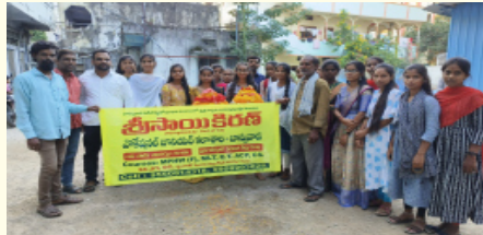
శ్రీ సాయి కిరణ్ కళాశాల ఆధ్వర్యంలో...