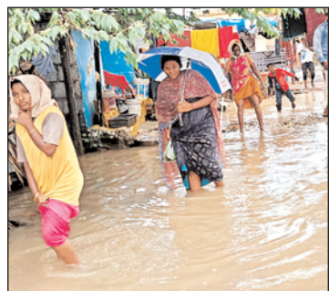
మొదటి పేజీ తరువాయి గ్రామస్థులు ఈ సందర్భంగా కలెక్టర్ ను కోరడం