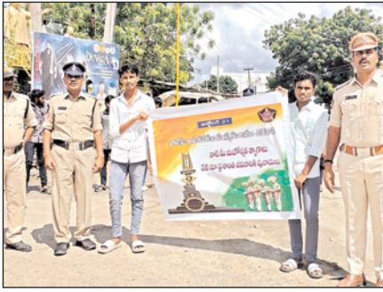
అంతర్గత శత్రువుల నుంచి ప్రజలను కాపాడి, భద్రతకు భరోసా ఇచ్చేది, సామాజిక ఆస్తులను