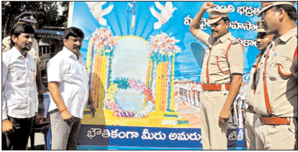
ప్రజల రక్షణలో పోలీసుల పాత్ర కీలకం - ఎమ్మెల్యే డాక్టర్ ఉగ్ర నరసింహారెడ్డి