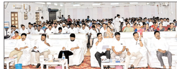
ఆసుపత్రికి కేటాయించాలి. ఆసుపత్రిలో డాక్టర్స్ కొరత ఉందన్నారు. డిప్యూటీ సీనియర్ వెళ్లిన డాక్టర్ మళ్ళీ గిద్దలూరు విధులు నిర్వహించే విధంగా అధికారులు చూడాలన్నారు.