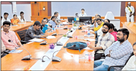
ప్రభుత్వం చర్యలు తీసుకుంటుందన్నారు. రైతులకు అవగాహన కల్పించడంలో నిర్దిష్టత ఉండరాదన్నారు. ప్రచార కార్యక్రమాలు, అవగాహన కార్యక్రమాలలో టాటా సంస్థ సహకారం ఉంటుందన్నారు. పంటల బీమా పథకానికి రైతులు స్వచ్ఛందంగా వచ్చి ప్రీమియం నగదు చెల్లించవచ్చున్నారు. మండలం, గ్రామస్థాయిలో వారానికి ఒకసారి సమావేశాలు నిర్వహించాలని పలు సూచనలు చేశారు. ఈ సమావేశంలో జిల్లా నుంచి జిల్లా వ్యవసాయ శాఖ అధికారి రామకృష్ణ, ఉద్యానవన శాఖ ఏడి జె జెమ్మమ్మ, సిపిఐ శ్రీనివాసరావు, వ్యవసాయ, ఉద్యానవనశాఖ అధికారులు తదితరులు పాల్గొన్నారు.

బాపట్ల, మేజర్ న్యూస్: పంటల బీమా పథకానికి రైతుల పేర్ల నమోదు ప్రక్రియ వేగంగా చేపట్టాలని జిల్లా సంయుక్త కలెక్టర్ ప్రభాకర్ జైన్ తెలిపారు. పంటల బీమా పథకం అమలు తీరుపై వ్యవసాయ శాఖ ప్రత్యేక కమిషనర్ బి రాజశేఖర్ అన్ని జిల్లాల కలెక్టర్లు వ్యవసాయ శాఖ జిల్లా, డివిజన్, మండల స్థాయి అధికారులతో గురువారం రాష్ట్ర రాజధాని నుంచి వీక్షణ సమావేశం నిర్వహించారు. వీక్షణ సమావేశానికి జిల్లా తరువున స్థానిక కలెక్టర్లతో నుంచి జిల్లా సంయుక్త కలెక్టర్, వ్యవసాయ శాఖ అధికారులు, హాజరయ్యారు. అనంతరం వ్యవసాయ శాఖ అధికారులతో జిల్లా సంయుక్త కలెక్టర్ కలెక్టర్లతో సమావేశమయ్యారు. పంటల బీమా పథకానికి రైతులే ప్రీమియం చెల్లించాలని జిల్లా సంయుక్త కలెక్టర్ తెలిపారు. ఈ విషయంపై రైతులకు విస్తృతంగా అవగాహన కల్పించాలన్నారు. డిసెంబర్ 15వ తేదీ నాటికి పంటల బీమా నమోదు ప్రక్రియ ముగించాలన్నారు. సి ఎస్ సి సెంటరు లేదా సచివాలయాలకు వచ్చి రైతులు తమ ప్రీమియాన్ని చెల్లించవచ్చున్నారు. సి సి ఆర్ సి కార్యదారులకు లబ్ధి చేకూర్చడానికి