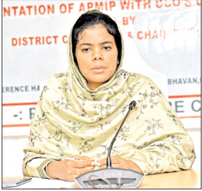
ఇరిగేషన్ పరికరాలు సమకూర్చేలా సంబంధిత కంపెనీలకు అనుమతి ఇచ్చామని చెప్పారు. దీనిపై కలెక్టర్ స్పందిస్తూ ఆసక్తి చూపుతున్న