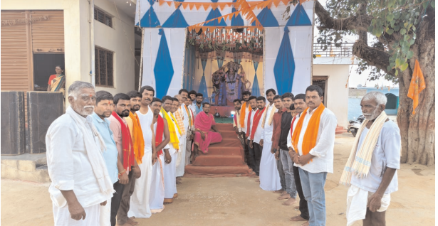
దౌల్రాబాద్ మేజర్ న్యూస్ (అక్టోబర్ 05): మండల కేంద్రంలో పాటు మండల పరిధిలోని వివిధ గ్రామాల్లో ఘనంగా దేవి