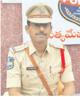
జరుగుతున్నట్లు సమాచారం...? ఈ మాయలోకంలో ఎప్పుడు ఏమీ జరుగుతుందో తెలియని పరిస్థితి నెలకొని ఉంటుంది అని పలువురు చర్చించుకుంటున్నారు.