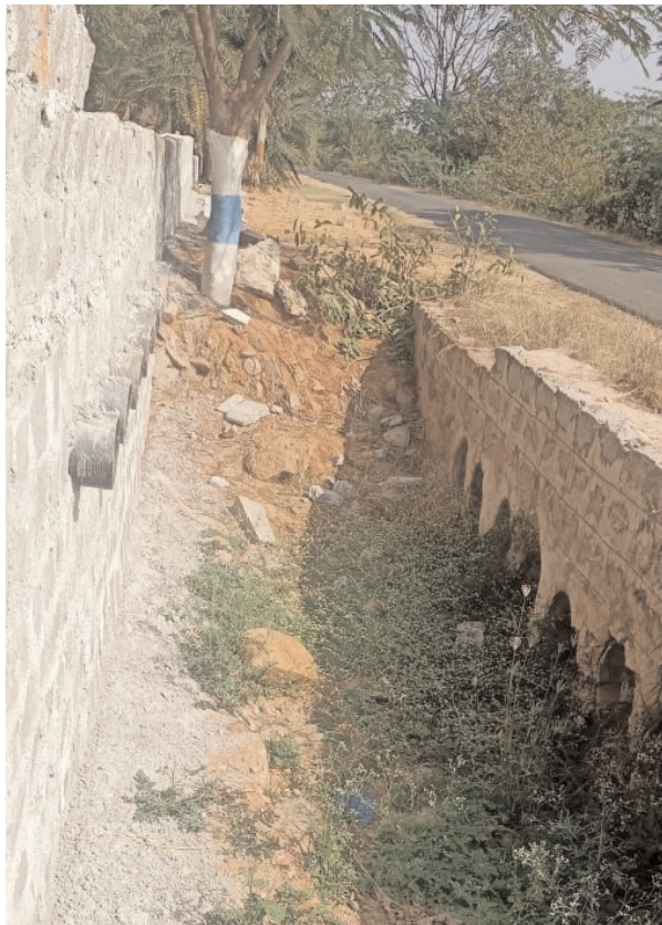
నాలా (సహజ సిద్ధంగా పారే కాలువ) ద్వారా వచ్చే నీటి వసతులకు అడ్డంగా ప్రహారీ కట్టిన దృశ్యం