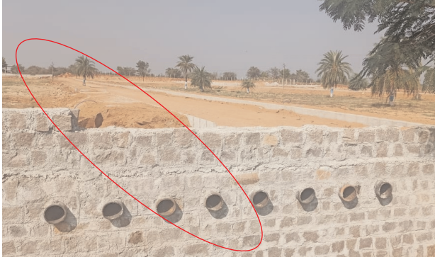
కాలువను నామరూపాలు లేకుండా చేసిన దృశ్యం

యాచారం, మేజర్ న్యూస్ (అక్టోబర్ 05) : మండల కేంద్రానికి 3-4 కిలోమీటర్ల తూరంలోని చింతపల్లె లక్షణ చెరువు చుట్టుపక్కల గ్రామాలకు జీవనాధారం. దాదాపు వెయ్యి ఎకరాల పరివాహక ప్రాంతం కలిగిన ఈ చెరువులోకి కాలువల ద్వారా భారీగా నీరు వచ్చి చేరుతుంది. ఇదిలా ఉంటే... చింతపల్లె రెవెన్యూ పరిధిలోని 581, 582, 583, 584 తదితర సర్వే నెంబర్లలో శ్రీ భువి పేరుతో ఓ రియల్ ఎస్టేట్ సంస్థ వెంచర్స్ ఫ్లాన్ చేసింది. ఈ మొత్తం వెంచర్ మధ్యలోనుంచి లక్షణ చెరువులోకి వెళ్లే వర్షపునీటి కాలువ (నాలా)ఉంది. ఈ కాలువను నామరూపాలు లేకుండా చేసిన సంస్థ నిర్వహకులు కాలువ నీటి కోసం నామమాత్రంగా చిన్న చిన్న పైపులు పెట్టి చేతులు దులుపుకున్న వెంచర్ యజమానులు నాలాకు అడ్డంగా ప్రహరీ కట్టేందుకు బేస్మెట్ సిద్ధం చేసుకున్నారు. ఇప్పుడు ఈ పరిణామమే చర్చనీయాంశంగా మారింది. భారీగా