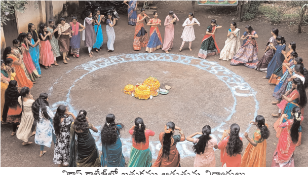
వికాస్ కాలేజీలో బతుకమ్మ ఆడుతున్న విద్యార్థులు.