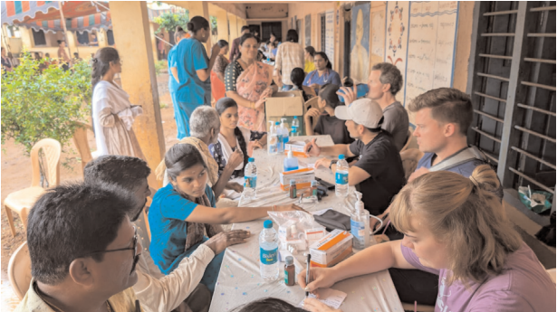
గ్రామంలో వైద్యం చేస్తున్న దృశ్యం.