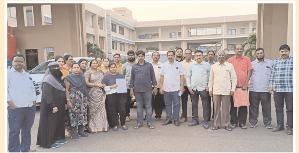
కలెక్టర్ ముందు బాధితులు.

వికారాబాద్, మేజర్ న్యూస్ (అక్టోబర్ 25) : వికారాబాద్ జిల్లా మోమిన్ పేట మండలం ఎన్సపల్లి గ్రామంలో తాము కొనుగోలు చేసిన ఫ్లాట్స్ కు హద్దులు చూపించాలని పలువురు కలెక్టర్ కార్యాలయంలో శుక్రవారం పిర్యాదు చేశారు. ఎన్సపల్లి గ్రామంలోని 86 సర్వే నంబర్ లో 6 ఎకరాల మూడు గుంటలు ఉంటుందని, ఈ సర్వే నంబర్ లో ఫ్లాట్లు చేసి 2016లో అమ్మారని దానిని తాము కొనుగోలు చేశామని అన్నారు. ప్రస్తుతం ఆ ఫ్లాట్స్ చూడగా గుర్తుతెలియని వ్యక్తులు హద్దులను చేర్చి వేసి ఫ్లాట్స్ ప్రదేశం చుట్టూ కాంపౌండ్ వాల్ కట్టారని అన్నారు. దీనిని రక్షించి తమకు హద్దులు పాతి ఇవ్వాలని కోరుతున్నామన్నారు.