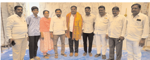
జిల్లా గ్రంథాలయ సంస్థ చైర్మన్ కు సన్మానించిన మాజీ వైస్ ఎంపీపీ తదితరులు