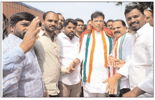
షాద్ నగర్, మేజర్ న్యూస్ (అక్టోబర్ 25) : రాష్ట్రంలో పారిశ్రామికాభివృద్ధికి పెద్దపీట వేసి అన్ని రంగాల్లో అభివృద్ధి సాధిస్తామని రాష్ట్ర ఐటీ పరిశ్రమల శాఖ మంత్రి దుద్దిక్ష శ్రీధర్ బాబు అన్నారు. మిగతా 2లో