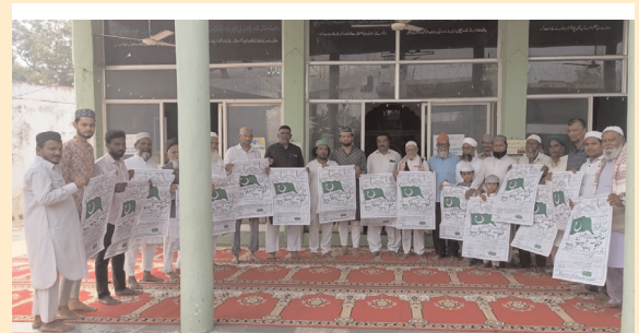
పోస్టర్ విడుదల చేస్తున్న మైనారిటీ నాయకులు