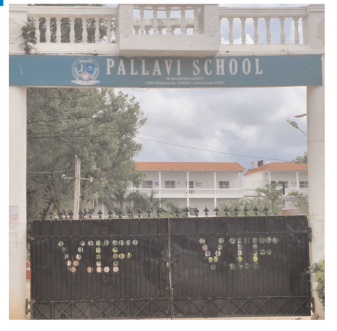
మొయినాబాద్, మేజర్ న్యూస్ (అక్టోబర్ 25) : రాష్ట్రంలో పార్టీల మధ్య అధికారం బదిలీ అయినా... ప్రభుత్వ భూములకు మాత్రం రక్షణ లేకుండా పోయింది. మిగతా 2లో