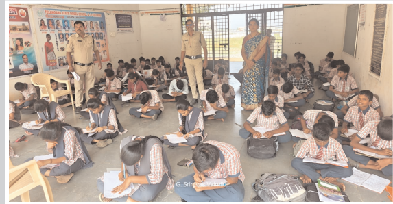
.పరీక్ష రాస్తున్న విద్యార్థులు.