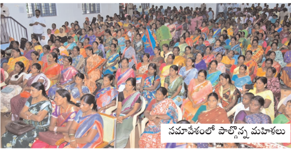
సమావేశంలో పాల్గొన్న మహిళలు

మొదటిపేజీ తరువాయి... దానికి ఇప్పుడు మన ప్రభుత్వం నెలకు ఏడు వేల కోట్ల రూపాయల మిల్లి కడుతుందని తెలిపారు. ఉద్యోగులకు జీతాలు ఇయ్యలేని పరిస్థితి ఉండేదన్నారు. ముఖ్యమంత్రి రేవంత్ రెడ్డి, మంత్రులు కష్టపడి పరిస్థితిని దారిలోకి తెస్తున్నారని తెలిపారు. గతంలో ఒకటో తారీఖు నుండి మొదలు పెట్టి ముప్పై తారీఖు వరకు జీతాలు ఇస్తుండే, ఇప్పుడు ప్రభుత్వ ఉద్యోగులకు ఒకటో తారీఖున జీతాలు వస్తున్నాయని తెలిపారు. బిఆర్ యస్ పదేళ్ళ పాలనలో తెల్ల రేషన్ కార్డులు ఇయ్యలేదని తెలిపారు. కానీ అన్ని ఇచ్చినం అంటారు. కేటీఆర్, హరీష్ రావుల మాటలు వింటే గజని సినిమాలో హీరోలాగా ఉంటాయి, ఓడిపో గానే అన్ని మర్చిపోతున్నారు. దామగుండంలో నేవీ రాడర్ స్టేషన్ ఏర్పాటుకు బిఆర్ఎస్ ప్రభుత్వం 2017 లోనే అనుమతులు ఇస్తూ జిఓ ఇచ్చిందని తెలిపారు. కేంద్ర ప్రభుత్వం రాష్ట్ర అటవీశాఖ కు నష్టపరిహారం కోసం ఇచ్చిన 135 కోట్ల రూపాయలు కూడా తీసుకున్నారు. మళ్ళీ విమర్శలు చేస్తున్నారు. మర్చిపోయి మాట్లాడుతున్నారు. ఇంతకు ముందున్న ఓఓం కు రాజకీయ అనుభవం లేదు. నియోజకవర్గంలో 2014 కు ముందు వేసిన రోడ్లు మాత్రమే ఉన్నాయి, గత పదేళ్ళలో కొత్తగా రోడ్లు వేయలేదు. మన ముఖ్యమంత్రి రేవంత్ రెడ్డి మాత్రం అందరూ కలిసి ఉండాలని ప్రతి నియోజకవర్గంలో రూ. 170 కోట్లతో ఇంటిగ్రేటెడ్ రెసిడెన్షియల్ స్కూల్స్ ఏర్పాటు చేస్తున్నాడు. ఇంతకు ముందున్న ముఖ్యమంత్రి తనకోసం, తన కుటుంబం కోసం చేసుకున్న, రేవంత్ రెడ్డి చేసేది మాత్రం ప్రజల కోసం మనకు ఇచ్చిన వాగ్దానాలను అమలు చేయడానికి కష్టపడుతున్నాడు. మనకోసం అహర్నితలు కష్టపడుతున్న ముఖ్యమంత్రి రేవంత్ రెడ్డి గారి ఆరోగ్యం బాగుండాలని మనమందరం భగవంతుని ఎల్లప్పుడూ ప్రార్థించాలి. నియోజకవర్గ ప్రజలకు ఇచ్చిన మాటను నిలబెట్టుకుంటాను. పురా