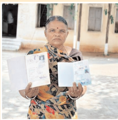
తనకు న్యాయం చేయాలని వేడుకుంటున్న బాధిత మహిళ రైతు