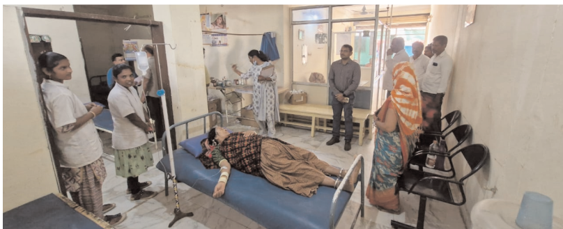
అర్హత లేకుండా విద్యం చేస్తున్న డాక్టర్తో మాట్లాడుతున్న దృశ్యం.