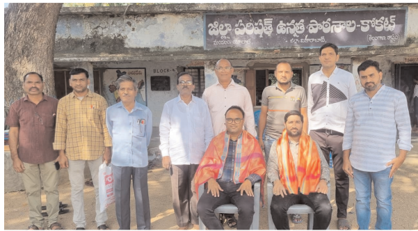
యాలాల మేజర్ స్కూల్స్ (అక్టోబర్ 26): మండలం పరిధిలోని కొకట్ జిల్లా