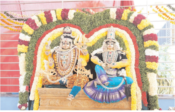
కీసర, మేజర్ న్యూస్(అక్టోబర్ 27): కీసర మండలం చీర్యాల గ్రామంలో రామాలయం పునర్నిర్మాణంలో భాగంగా నూతనంగా విగ్రహారూపంలో (గణపతి) విగ్రహ ప్రతిష్ఠ మహోత్సవం అత్యంత వైభవపాతంగా, శాస్త్రోక్తంగా నిర్వహించారు.