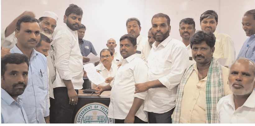
ప్రజావాణిలో ఫిర్యాదు చేసిన కరీంపూర్ గ్రామస్తులు ..

● ప్రజా వాణిలో ఫిర్యాదు చేసిన కరీంపూర్ గ్రామస్తులు