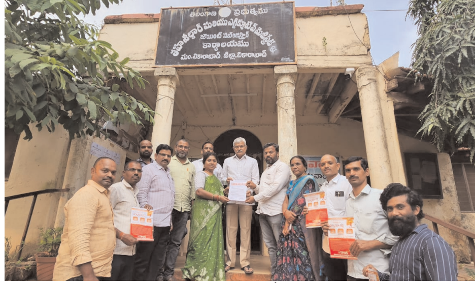
తహాసిల్దార్ కు వినతి పత్రం అందజేస్తున్న దృశ్యం.