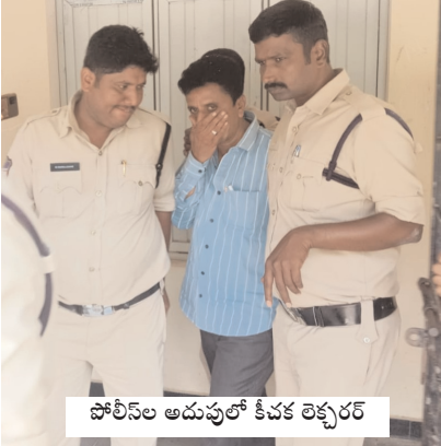
పోలీస్ అదుపులో కీచక లెక్కరర్

పెద్దేముల్ మేజర్ స్కూల్స్ ( అక్టోబర్ 28): పెద్దేముల్ మండల కేంద్రంలోని ప్రభుత్వ జూనియర్ కళాశాలలో హిందీ లెక్కరర్ కొన్ని రోజులుగా విద్యార్థినుల పట్ల అసభ్యంగా ప్రవర్తిస్తున్నాడు అని కొందరు విద్యార్థినులను బార్గెట్ చేసి వాష్ రూమూల దగ్గర నిలబడి, అసభ్యంగా మాట్లాడటం, విద్యార్థినుల