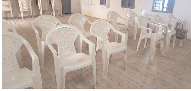
అధికారులు డుమ్మా కొట్టడంతో కాల్గి ఉన్న కుర్చీలు