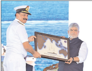
స్పీకర్ ప్రసాద్ కుమార్ కు జ్ఞాపికను అందజేస్తున్న నేవీ అధికారులు.

వికారాబాద్ జిల్లా ప్రతినిధి, మేజర్ న్యూస్ (అక్టోబర్ 15) వికారాబాద్ జిల్లా పూడూర్ మండలం దామగుండంలో నూతనంగా ఏర్పాటు చేసిన నేవీ రాడార్ ప్రాజెక్టు పనులకు మంగళవారం కేంద్ర రక్షణ శాఖ మంత్రి రాజ్ నాథ్ సింగ్, రాష్ట్ర ముఖ్యమంత్రి రేవంత్ రెడ్డితో కలిసి శంకుస్థాపన చేశారు. ఈ కార్యక్రమంలో కేంద్ర మంత్రి బండి సంజయ్ కుమార్, తెలంగాణ రాష్ట్ర శాసన సభాసభాసతి గడ్డం ప్రసాద్ కుమార్, శాసనమండలి చీఫ్ విప్ పట్నం మహేందర్ రెడ్డి, రాష్ట్ర అటవీశాఖ మంత్రి కొండా సురేఖ, ఎంపీలు కొండా