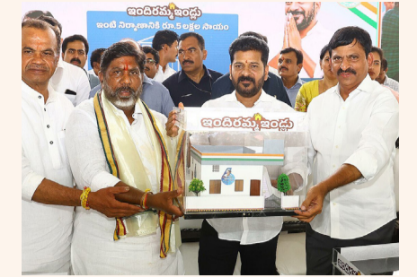
సమయం గడిచిన కొలిక్కిరాని ఇందిరమ్మ కమిటీలు

ఇందిరమ్మ ఇల్లు కట్టినాన్న కాంగ్రెస్ ప్రభుత్వానికి తొలిదశలోనే ఎదురుదెబ్బ... ఇందిరమ్మ కమిటీలు కూడా ఏర్పాటు చేయలేక తలలు వట్టుకున్న నేతలు. ఇందిరమ్మ ఇళ్ల పథకం అమలు చేసేందుకు కమిటీలను ఏర్పాటు చేయాలని ప్రభుత్వం నిర్ణయించింది. అయితే లబ్ధిదారుల ఎంపిక నిమిత్తం పట్టణాల్లో ఇందిరమ్మ కమిటీలోకి సభ్యులను తీసుకోవాలని నిర్ణయించిన విషయం తెలిసిందే. ఈ నెల 11వ తేదీలోపు కమిటీల నియామక ప్రక్రియ పూర్తికావాలి. ఉన్నా.. అధికార పార్టీ నేతల మధ్య సమస్య లోపం, అధికారుల అవగాహన రాహిత్యంతో ఇప్పటికే కమిటీలు ప్రతిపాదన దశలోనే ఉన్నాయి. ప్రభుత్వం ఓ వైపు దీపావళి నుంచి ఇందిరమ్మ పథకం కింద ఎంపికైన లబ్ధిదారుల ఇళ్ల నిర్మాణాలకు ముగ్గుపోయాలని నిర్ణయించగా.. జిల్లాలో మాత్రం ఈ ప్రక్రియ ప్రారంభం జాప్యం జరిగే అవకాశాలున్నాయి.