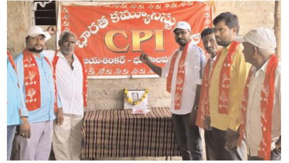
ప్రాఫెసర్ సాయి బాబా మరణం సమాజానికి తీరని లోటు

అభివృద్ధి చెయ్యండి..వర్గాలు కాదు వర్గాలు సృష్టిస్తే బిఆర్ఎస్ పార్టీకే లాభం టీపీసీసీ ప్రధాన కార్యదర్శి- భీమగాని సౌజన్య