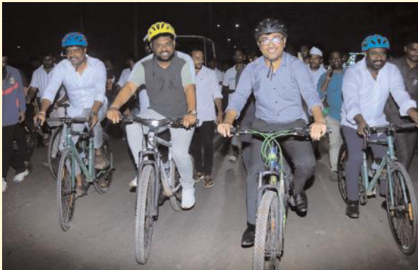
మొదటి పేజీ తరువాయి..

పట్టణ, గ్రామీణ ప్రాంతాల నుండి ఎక్కువ క్రీడాకారులు పాల్గొనే విధంగా అవగాహన కల్పించడమే ముఖ్య లక్ష్యమని అన్నారు. గ్రామీణ స్థాయి నుండి యువత పెద్ద ఎత్తున సీఎం కేసీఆర్ క్రీడలలో పాల్గొని విజయవంతం చేయాలని ఆయన కోరారు. జిల్లా కలెక్టర్ మాట్లాడుతూ గ్రామీణ ప్రాంత క్రీడాకారులను ప్రోత్సహించేందుకు రాష్ట్ర ప్రభుత్వం చేపట్టిన ఈ అద్భుత అవకాశాన్ని