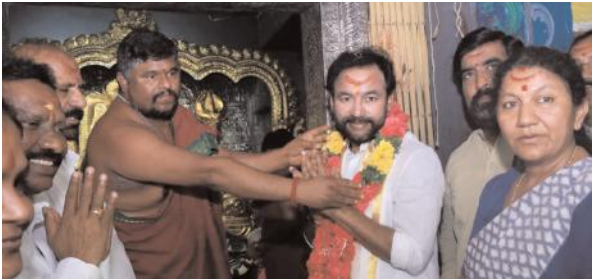
శ్రీ భద్రకాళి అమ్మ వారికి ప్రత్యేక పూజలు చేసిన కేంద్ర మంత్రి కిషన్ రెడ్డి....

సూర్య బ్యూరో ఉమ్మడి వరంగల్, అక్టోబర్ 14, దేశ అభివృద్ధి కోసమే బిజేపి పార్టీ పని చేస్తుందని కేంద్ర బౌగ్గు గనుల శాఖ మంత్రి కిషన్ రెడ్డి అన్నారు. సోమవారం కేంద్ర మంత్రి కిషన్ రెడ్డి ఓరుగల్లు భద్రకాళి దేవస్థానంలో అమ్మవారిని దర్శించుకొని ప్రత్యేక పూజలు నిర్వహించారు. ఈ సందర్భంగా కిషన్ రెడ్డి మాట్లాడుతూ ఢిల్లీ నుంచి గల్లీ దాకా ఆధ్యాత్మిక శోభతో దేవాలయాలను అభివృద్ధి చేయడమే ద్యేయంగా మోడి సర్కార్ పని చేస్తుందని చెప్పారు. ఓరుగల్లు చారిత్రక దేవాలయాలపై రాష్ట్ర ప్రభుత్వ పర్యాటక శాఖ సుచనల మేరకు కావాల్సిన నిధులను కేంద్రం సమకూరుస్తుందని చెప్పారు. ఇప్పటి వరకు దేశ వ్యాప్తంగా 150 దేవాలయాలను పరిగణలోకి తీసుకున్నామని తెలిపారు. గత పాలనలో ఆలయాల్లో ప్రవేశాలకు నిబంధనలు ఉండేవని కానీ ఇప్పుడు ప్రతి ఒక్కరికి ఎలాంటి నిబంధన లేకుండా ఆలయ ప్రవేశాలు కల్పిస్తున్న ప్రభుత్వం మోడి ప్రభుత్వమన్నారు. ఓరుగల్లు శ్రీ భద్రకాళి అమ్మ వారు అంటే నాకు మంచి నమ్మకమని చెప్పారు. కుల మతాలకు తేడా లేకుండా దేశంలో జరుగుతున్న ఆధ్యాత్మిక కార్యక్రమాల్లో ప్రతి ఒక్కరూ పాల్గొంటున్నారని తెలిపారు. ప్రతి ఒక్కరికి భక్తి భావన ఉంటే దేశ అభివృద్ధికి సమాజ ఎదురుదలలకు సంస్కృతి సంప్రదాయాలకు నెలమైగా దేశం తయారవుతుందన్నారు. దేశంలో ఉన్నటువంటి మారుమూల గ్రామాల్లో నుండి చంద్ర మండలం వరకు త్రివర్ణ పతాకం ఎగిరేసేంత శక్తి కేవలం నరేంద్ర మోడి నాయకత్వంలో సాధ్యమైందన్నారు. ఓరుగల్లు కాకతీయ చారిత్రక ప్రదేశాలు ఇక్కడ ఉన్నటువంటి ఆధ్యాత్మిక దేవాలయాలపై కేంద్రం ఎప్పటి నుంచో దృష్టి సారించిందన్నారు. అప్పటి రాష్ట్ర ప్రభుత్వ సూచనల మేరకు రామప్ప దేవాలయానికి యునెస్కో గుర్తింపు తీసుకొచ్చిన ఘనత నరేంద్ర మోడిదన్నారు.