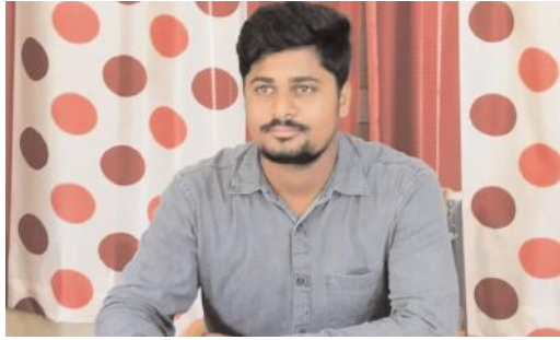
నూతన వ్యవసాయ అధికారిగా