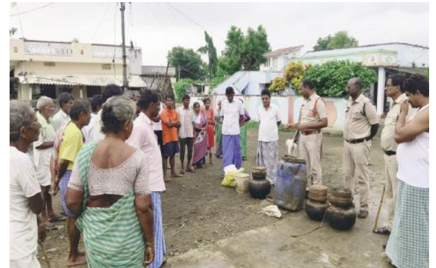
వ్యతిరేక కార్యకలాపాలకు పాల్పడే వారిని ఉపేక్షించేది లేదని ఆయన అన్నారు.