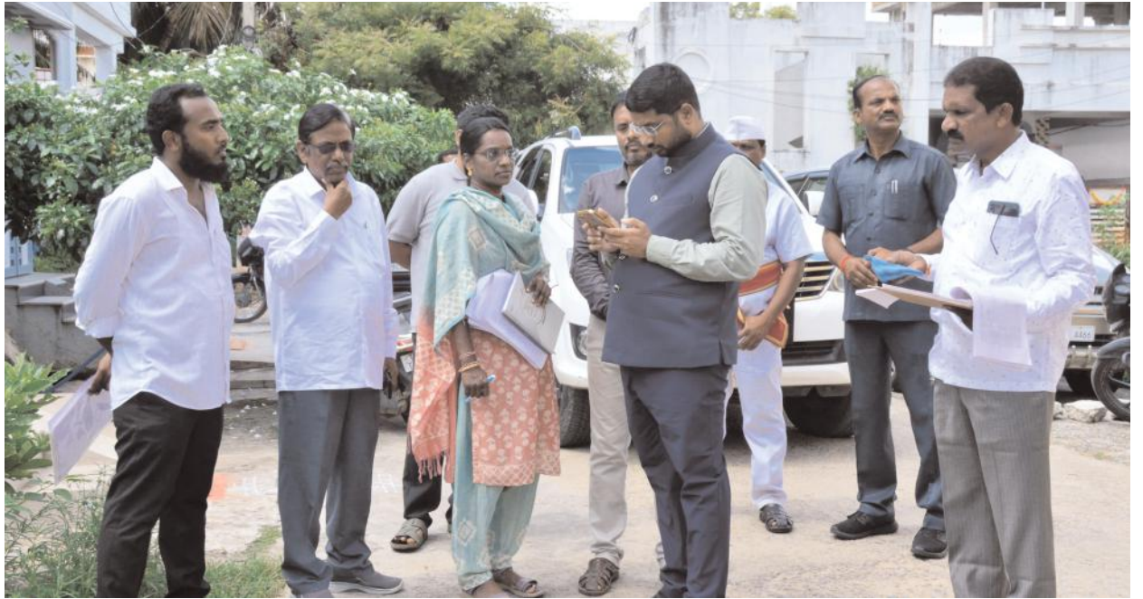
తేమ, నిబంధనల పైన అధికారులు విస్తృత ప్రచారం చేయాలన్నారు.

జనగామ అర్బన్, అక్టోబర్ 19, మేజర్ న్యూస్: పత్తి రైతులకు ఇబ్బందులు లేకుండా సజావుగా కొనుగోళ్లు జరగాలని జనగామ జిల్లా కలెక్టర్ షేక్ రిజ్వాన్ బాషా అన్నారు. శనివారంపత్తి కొనుగోలు కి సంబంధించి పత్తి మిల్లుల్లో చేసిన ఏర్పాట్లను, తీసుకుంటున్న జాగ్రత్త చర్యల గురించి సీసీఐ, మార్కెటింగ్ శాఖ అధికారులను కలెక్టర్ అడిగి తెలుసు కున్నారు. ప్రతీ పత్తి మిల్లులలో ఎప్పటికప్పుడు తూకం యంత్రాల పని తీరును పరిశీలించుకోవాలని, అగ్ని ప్రమాదాలు జరుగకుండా అధికారులు తగు జాగ్రత్త చర్యలు చేపట్టాలన్నారు. షోలీన్, రవాణా అధికారులు ట్రాఫిక్ ఇబ్బందులు తలెత్తకుండా జిన్నింగు మిల్లుల వద్ద తగు ఏర్పాట్లు చేయాలని ఆదేశించారు. పత్తి కొనుగోలు కేంద్రాల వద్ద రైతులకు తాగునీరు, నీడ వంటి సదుపాయాలు కల్పించాలని సూచించారు. రైతులు తమ ఆధార్ నెంబర్ను ఎన్రోల్ చేసుకొని పత్తి విక్రయాలు చేసుకోవాలన్నారు. రూ.7,521 గా ప్రభుత్వం గిట్టుబాటు ధరను ప్రకటించింది, బ్యాంకు ఖాతాను ఆధార్ నెంబర్తో లింక్ చేసుకోవాలని తెలిపారు. దళారుల ను నమ్మి మోసపోవద్దని, సీసీఐ కేంద్రాల్లో పత్తి విక్రయాలు చేసుకోవాలన్నారు. పత్తి కొనుగోళ్లకు రైతుల ఆధార్ ప్రామాణికమని, రైతులందరూ తమ బ్యాంకు ఖాతాలను ఆధార్ తో అనుసంధానం చేసుకునే విధంగా వ్యవసాయ శాఖ, మార్కెటింగ్ శాఖ అధికారులు రైతులకు అవగాహన కల్పించాలన్నారు. రైతులకు పత్తి