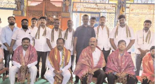
ఆయన వెంట వివిధ శాఖల అధికారులు నాయకులు పాల్గొన్నారు.