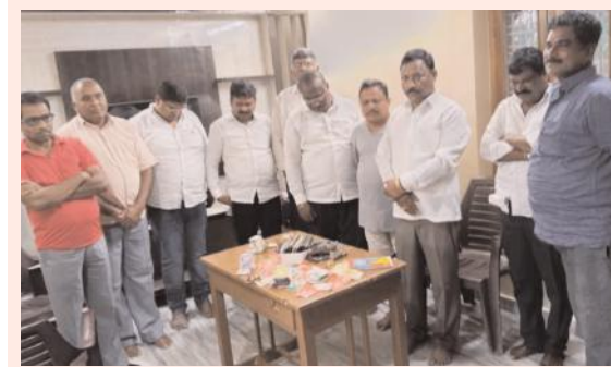
పేకాట రాయుళ్ళ అరెస్ట్