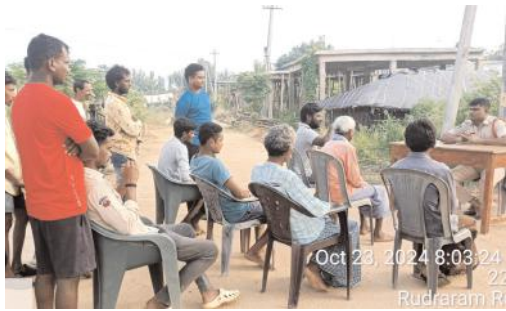
Oct 23, 2024 8:03:24 Rudharam R