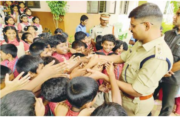
-పోలీస్ విధి విధానాల, పోలీస్ స్టేషన్ పనితీరు,