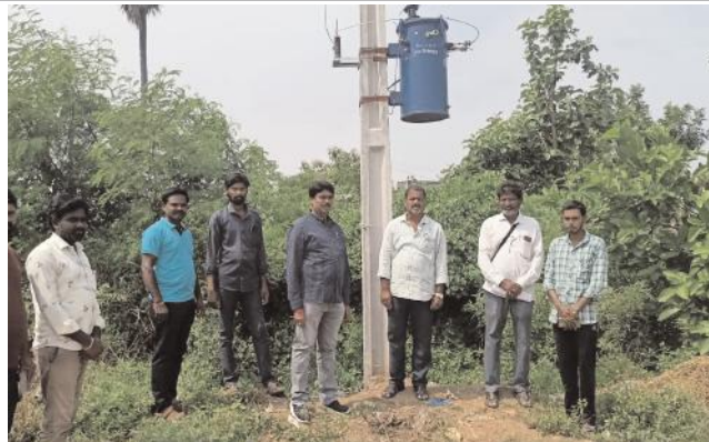
లక్షల40 వేల రూపాయల విలువ గలఅదనపు ట్రాన్స్ పార్మర్లు ప్రారంభించినట్లు తెలిపారు.ఈకార్యక్రమంలో శ్రీరామగిరి సబ్ స్టేషన్ సిబ్బంది పాల్గొన్నారు.