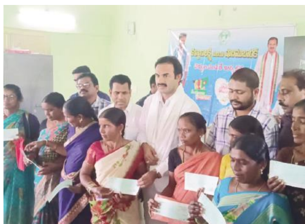
-కళ్యాణ లక్ష్మి చెక్కులు పంపిణీ