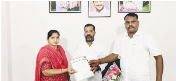
ఎమ్మెల్యే నాయిని రాజేందర్ రెడ్డి కి వినతి పత్రం