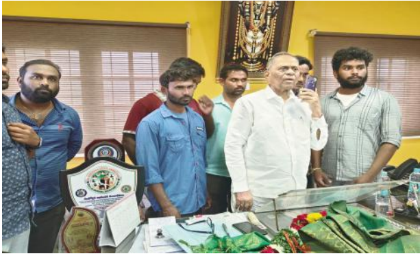
హార్షం వ్యక్తం చేస్తున్న కార్మికులు.

మహబూబాబాద్ రూరల్, అక్టోబర్ 28, మేజర్ న్యూస్(సూర్య): మహబూబాబాద్ లో ఇటీవలే భారీ వర్షం కారణంగా తల్లపూసపల్లి,కేశముద్రం మధ్యలో కొట్టుకపోయినా ట్రాక్ ను గుర్తించి ఎంతోమంది ప్రాణాలను కాపాడిన విషయం అందరికీ తెలిసినదే ఇదే విషయం పట్ల జిఎం అవార్డు వచ్చే విషయం లో మాకు అన్యాయం జరిగింది.దినికి కారణం మజూర్ యూనియన్