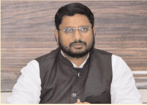
అర్చనలైన ప్రతి టీవర్ ఓటరుగా నమోదు చేసుకోవాలి

జిల్లా సమీకృత కలెక్టర్ కార్యాలయంలో మూడు ఓటరు నమోదు కేంద్రాల ఏర్పాటు జిల్లా కలెక్టర్ షేక్ రిజ్వాన్ బాషా