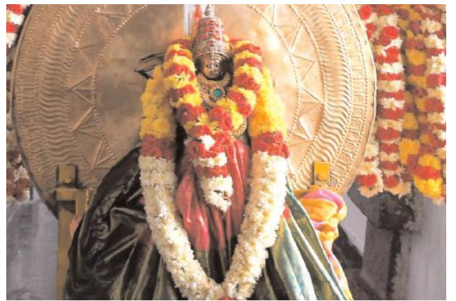
భక్తులను ఎంతగానో అలరించాయి.