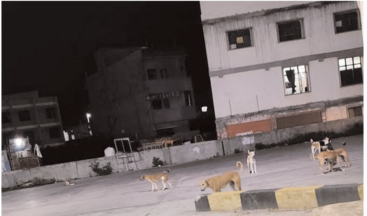
ఎప్పటి లాగే మాకేంది అని చూస్తూ ఊరుకుంటారో వేచి చూడాలి అని స్థానికులు వాపోతున్నారు

వర్ధన్నపేట అక్టోబర్ 06(మేజర్ న్యూస్ సూర్య); వర్ధన్నపేట కేంద్రంలో దాదాపు 8 నుంచి 10 కుక్కలు పట్టణంలోని బస్ స్టాండ్ ను స్థావరంగా చేసుకొని ప్రయాణికులను భయభ్రాంతులకు గురి చేస్తున్నాయి బస్సు దిగే వారిని,ఎక్కె వారిని వెంబడిస్తూ ఉండడంతో ప్రాణాలను గుప్పిట్లో పెట్టుకొని ప్రయాణిస్తున్న ప్రజలు ఆహారం దొరకకపోవడంతో బస్ స్టాండ్ లో సేద తిరుతున్న ప్రయాణికుల చెప్పులు ఎత్తుకెళుతున్న శునకాలు. వీధి కుక్కల సంరక్షణ కేంద్రం అంటూ కేవలం ఒక ప్లాకీ ఏర్పాటు చేసి చేతులు దులుపుకున్నారు మున్సిపల్ అధికారులు,కానీ ఎక్కడి కుక్కల అక్కడే ఉన్నాయని అధికారుల పట్ల పట్టణ ప్రజల ఆగ్రహం వ్యక్తం చేస్తున్నారు కుక్కల నియంత్రణ కొరకు ఎటువంటి చర్యలు తీసుకుంటున్నారని ఫోన్ లో మున్సిపల్ కమిషనర్ నీ అడగగా నేను మళ్ళీ ఫోన్ చేసి మాట్లాడుతా అని దాటవేసిన కమిషనర్ అనేక సార్లు వీధి కుక్కల సమస్యను అధికారుల దృష్టికి తీసుకెళ్లినా కూడా ఎటువంటి చర్యలు తీసుకొని మున్సిపల్ అధికారులు బాధ్యత తీసుకోవాల్సిన మున్సిపల్ అధికారులే ఏమీ పట్టనట్లు,అసలు అది మా పనే కాదన్నట్లు వ్యవహరిస్తే ఇంకెవరు బాధ్యత తీసుకుంటారని మున్సిపల్ అధికారులను ప్రశ్నిస్తున్న ప్రజలు.ఇప్పటికైనా అధికారులు స్పందించి వీధి కుక్కల సమస్య నుండి ప్రజలకు విముక్తి కలిగిస్తారో,లేదా