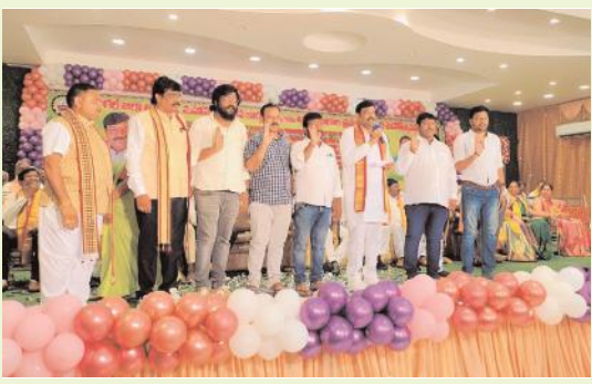
జిల్లా ఆర్యవైశ్య మహాసభలో పర్యటించిన మండలం నుండి