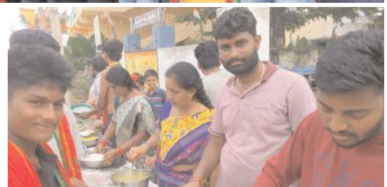
వివరించారు. భక్తులు అధిక సంఖ్యలో విచ్చేసి అమ్మవారిని దర్శించుకున్నారు.

వెంకటాపూర్(రామప్ప) అక్టోబర్ 6 మేజర్ న్యూస్ సూర్య: మండల వ్యాప్తంగా మారుమ్రో గుతున్న దేవి నవరాత్రి ఉత్సవాలు నిర్వహించి కొనసాగుతున్నాయి. వెంకటాపూర్, నల్లగుంట్ల, పాలంపేట, కేశవపూర్ మరియు వివిధ గ్రామాలలో ప్రతిష్ఠించిన దేవీ నవరాత్రి ఉత్సవాల్లో భాగంగా నాలుగవ రోజైన ఆదివారం శ్రీ లలితా త్రిపుర సుందరి దేవిగా భక్తులకు అమ్మవారి దర్శనం గావించారు. ఈ సందర్భంగా అర్చకులు అమ్మవారిని బంగారు వర్ష రూపం కలిగిన చీరతో అలంకరించి, నైవేద్యం సమర్పించారు. శ్రీ లలితా త్రిపుర సుందరి దేవి అలంకరణలో దర్శనమిచ్చే సమయంలో పరమేశ్వరుడు త్రిపురేశ్వరుడుగా, అమ్మవారు త్రిపుర సుందరి దేవిగా పూజలు అందుకుంటారని తెలిపారు. భక్తులు శ్రీ లలితా సహస్రనామ పారాయనం విశేషంగా చేయాలని భక్తులకు సూచించారు. బ్రహ్మ, విష్ణు, మహేశ్వరులు త్రిముర్తులకన్న పూర్వం నుండి జగన్మాత ఉంది కాబట్టి త్రిపుర సుందరి అనే నామంతో ఉన్నదని అందుకని అమ్మవారిని త్రిపుర సుందరి అనే నామంతో పిలువబడుతుందని