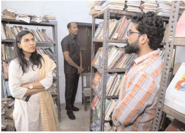
గ్రంథాలయానికి వనరుల కల్పనకు చర్యలు