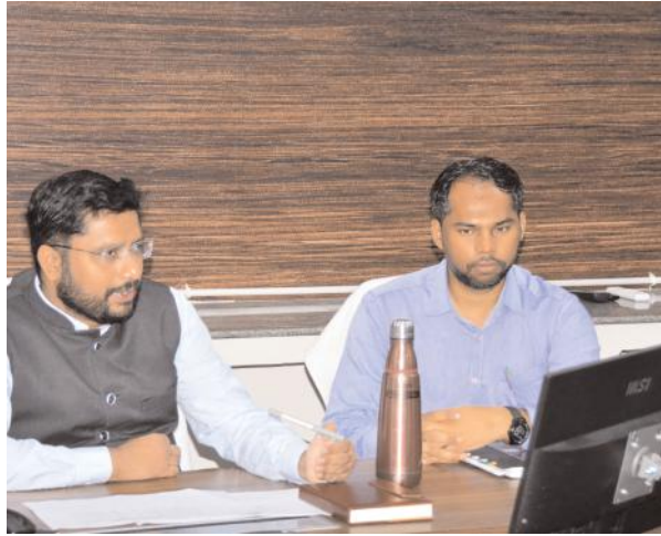
సారించాలని, ప్రణాళికాబద్ధంగా ముందుకు వెళ్లాలని సూచించారు. వీడియో