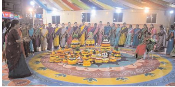
పూల ధరలకు రెక్కలు...

తెలంగాణలో ప్రధాన పండుగలు సద్గుల బతుకమ్మ, దసరా ఏడాదంతా ఈ పండుగల కోసమే ప్రజలు ఎదురుచూస్తుంటారు. ఈ పండుగలకు కొత్త బట్టలు కొనుగోలు చేయడం అనవాయితీ. ఉమ్మడి జిల్లా వ్యాప్తంగా నగర వాసులు, మట్టు పక్కల గ్రామాల ప్రజలు దస్తులు, పండుగల సామాగ్రిని కొనుగోలు చేస్తుంటారు. దీంతో ప్రధాన కూడళ్లు, సముదాయాలు కిట కిటలాడుతున్నాయి. మరో వైపు బతుకమ్మ కు అవసరమైన పూల విక్రయాలు జోరుగా సాగాయి.