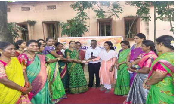
ఫీల్డ్ అసిస్టెంట్లు వివిధ కార్యాలయ మహిళా ఉద్యోగులు పాల్గొన్నారమహిళా ఉద్యోగులు బతుకమ్మలను అందంగా తయారుచేసిన వారికి మరియు పాటలు పాడిన వారికి బహుమతులు ప్రధాన చేయడం జరిగింది.