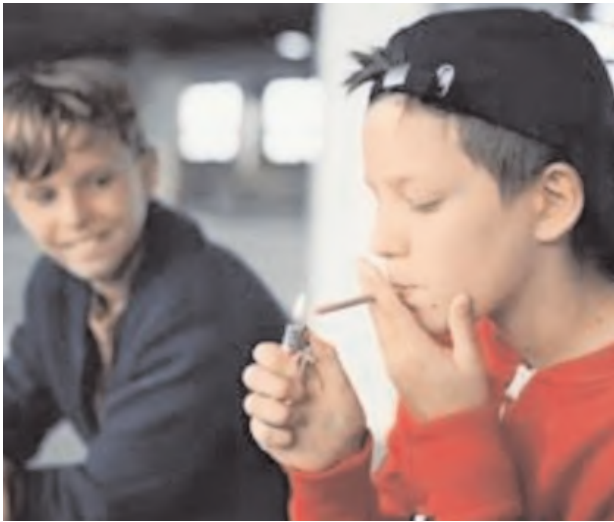
క్లర్లను సంప్రదించాలని విశ్లేషకులు తెలిపారు. ఒకవేళ వారి పట్ల నిర్లక్ష్యం వహిస్తే వారి బంగారు భవిష్యత్తు కానరాకుండా పోవడం ఖాయమని పలువురు స్పష్టం చేశారు.

మొగ్గళ్ల పల్లి అక్టోబర్ 9 మేజర్ న్యూస్ (సూర్య): పట్టుమని పది సంవత్సరాలు కూడా నిండని యువకులు, ఈ టెక్నాలజీ రంగంలో సెల్ ఫోన్ వాడుతూ అందులో వచ్చే వీడియోలకు ఆకర్షితులై బంగారు భవిష్యత్ కోసం శ్రమించాలిని యువకులు గంజాయి మత్తు లో పడి తెలియని ఆనందా కోరుకుంటూ మత్తు కు బానిసలుగా మారుతున్నారు అని పలువురు విశ్లేషకులు తెలిపారు. మత్తునే ఒక ఫ్యాషన్ గా మార్చుకొని చిన్న ప్రాయంలోనే చెడు మార్గాలను అన్వేషిస్తున్నారని పేర్కొన్నారు. పట్టణ ప్రాంతాల్లో చదువుకుంటున్న పిల్లలు అక్కడ సంస్కృతికి అలవాటు పడి అదే అలవాటును గ్రామాలకు వచ్చి పల్లెల్లో కొనసాగిస్తున్నారని అభిప్రాయా వ్యక్తమౌతుంది. ప్రధానంగా తల్లిదండ్రులు లేని సమయంలో గానీ, సాయంకాల వేళల్లో కొంతమంది స్నేహితులతో కలిసి ఆయా గ్రామాల్లో రహస్య ప్రాంతాలకు వెళ్లి ఈ వ్యవహారాన్ని కొనసాగిస్తున్నారని పలువురు పేర్కొన్నారు. తల్లిదండ్రులు పట్టణంకోకపోవడం, పట్టణంకున్న వారి మాట వినకపోవడం అనేటవంటిది కోకొల్లలు గా జరుగుతుందనే భావన వ్యక్తం అవుతుంది. ఒకవేళ గట్టిగా మందలిద్దం అనుకున్న ఎలాంటి అపరాధాలకు పాల్పడుతారో అన్న భయం తల్లిదండ్రుల్లో ఉందని అభిప్రాయాలు వ్యక్తమవుతున్నాయి. ఇకనుంచైనా యువకుల ముఖవళికలు గమనించి తల్లిదండ్రులు వారి విషయంలో జాగ్రత్తలు వహించాలని, వారికి అవసరమైన కౌన్సిలింగ్ చేపట్టాలని, సంబంధిత డాక్టర్లను సంప్రదించాలని విశ్లేషకులు తెలిపారు. ఒకవేళ వారి పట్ల నిర్లక్ష్యం వహిస్తే వారి బంగారు భవిష్యత్తు కానరాకుండా పోవడం ఖాయమని పలువురు స్పష్టం చేశారు.