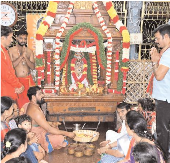
సరస్వతి మాతగా శ్రీ భద్రకాళి అమ్మవారు