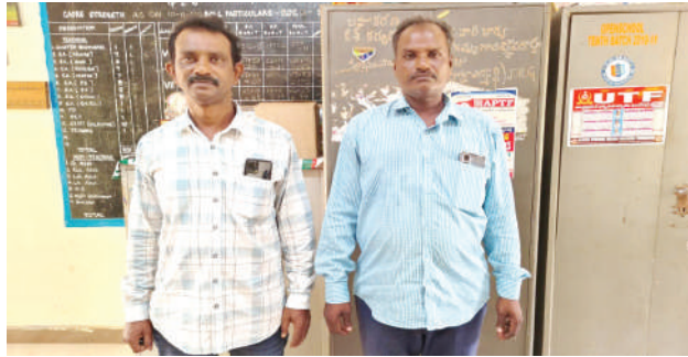
జంగారెడ్డిగూడెం,మేజర్ సూర్య: జంగారెడ్డిగూడెం జిల్లా పరిషత్ బాలుర పాఠశాలలో ప్రభుత్వ ప్రభుత్వ మెను ప్రకారం నాణ్యమైన భోజనం

- జెడ్పి బాలుర పాఠశాల పెరెంట్స్ కమిటీ చైర్మన్ వెల్లడి