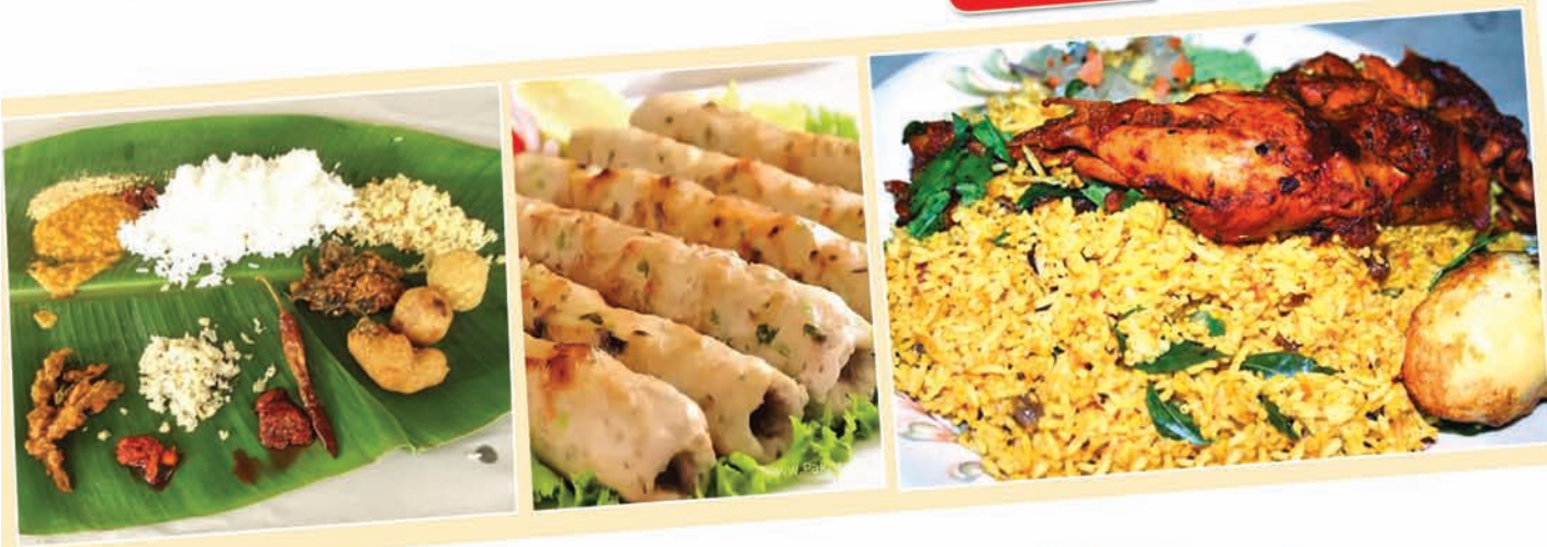
(గుంటూరు జిల్లా నేటి దినపత్రిక సూర్య బ్యూరో)

ఒకవైపు కాలుష్యం కోరసాచి ప్రజల ఆయువును తగ్గిస్తోంది. దీనికి తోడు ఆహార కల్తీ సైతం ప్రజారోగ్యానికి పెను ప్రమాదంగా పరిణమించింది. ముఖ్యంగా వ్యవస్థాగత లోపాలే కల్తీరాయుక్లకు వరంగా మారుతున్నాయి. ఆహార భద్రతకు సంబంధించి ఆయా జిల్లా లకు ఆహార భద్రత, ప్రమాణాల ప్రాధికార సంస్థ (ఎఫ్ఎస్ఎస్ఎఫ్ఐ) ఇటీవల ర్యాంకులు ప్రకటించింది. ఈ జాబితాలో,