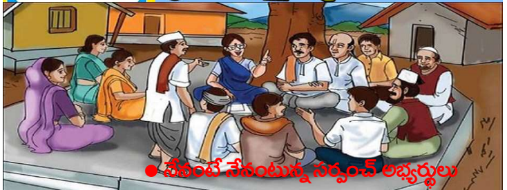
వేదంపే వేసంతున్న సర్పంచ్ లభ్యర్థులు