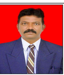
మందమరి, నవంబర్ 5, సూర్య మేజర్ స్కూల్స్.

- ట్రస్టా రాష్ట్ర కార్యవర్గంలో మంచెర్యాల జిల్లా నుండి పలువురికి చోటు