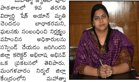
నిర్మల్ నవంబర్ 5, సూర్య మేజర్ స్కూల్స్