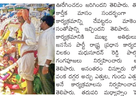
జాతర కార్యక్రమంలో పాల్గొన్న ప్రజలు.