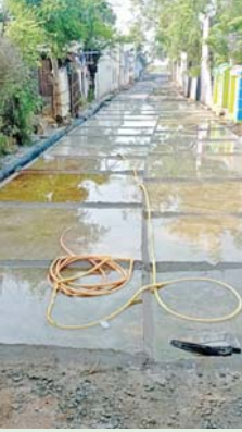
సోమండేపల్లిలో రోడ్డు పనులు.